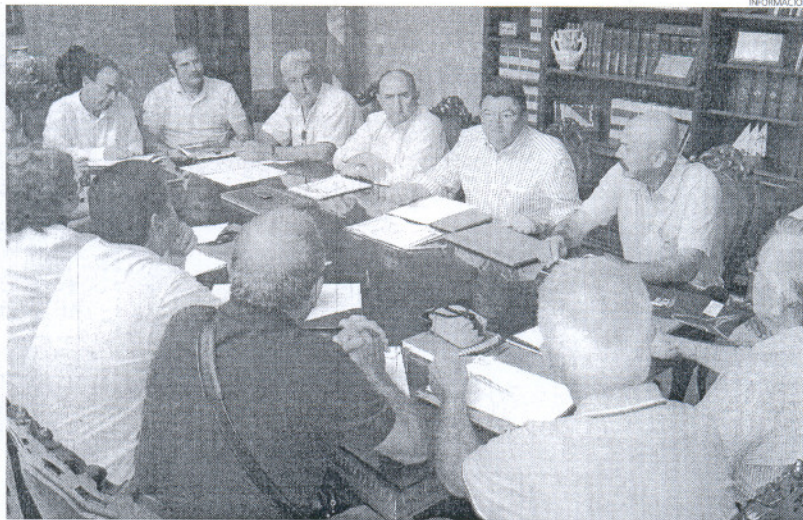
El alcalde expuso en el encuentro los factores que desde el Consistorio han considerado cruciales en esta crisis.

En su intervención, el alcalde de Rota ha llamado la atención