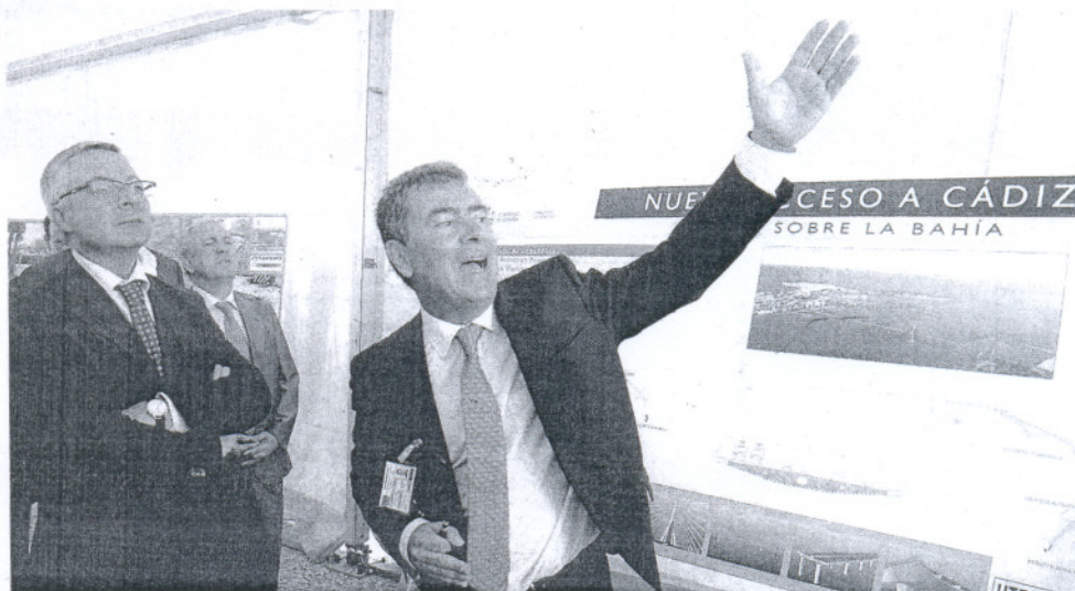
José Blanco, ministro de Fomento, atento a las explicaciones que le ofrecieron ayer durante su visita a Cádiz

Ni la Guardia Civil ni la Delegación del Gobierno en Andalucía informaron en su momento de los hechos