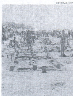
Los participantes en su zona.

encontraban una bolsa de tela con cuadernos, una camiseta, un cuclgamóvil, o un vale descuento adicional para el cine, así como un libro de pasatiempos sobre el medio ambiente.