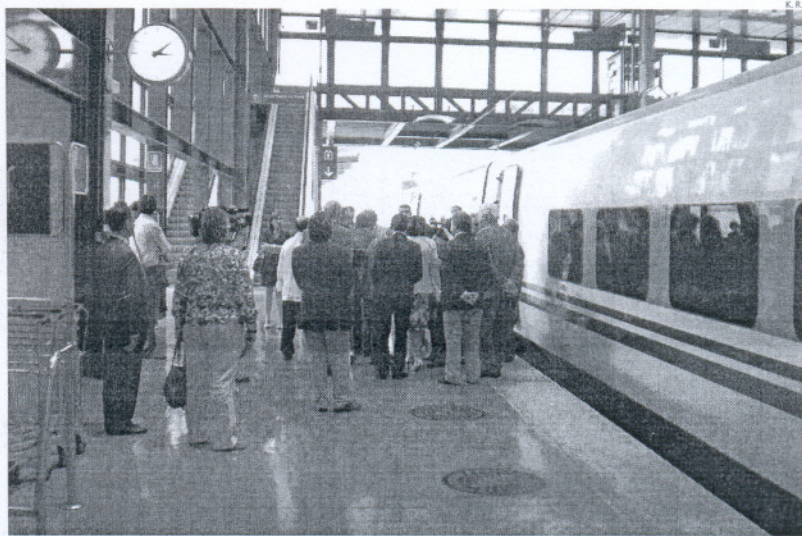
Los trenes de Alta Velocidad ya paran en Cádiz pero circulan por las vías convencionales.

De esta manera, se ofrecerán 1.000 plazas más al día ya que el mes que viene y antes de que acabe el 2010 se reducirán en 15 minutos los tiempos de viaje entre Cádiz y Sevilla. Por último, el ministro de Fomento recordó que en la provincia de Cádiz se han invertido a lo largo de este año 450 millones de euros en mejorar las infraestructuras para facilitar al máximo la movilidad sostenible de personas y mercancías.