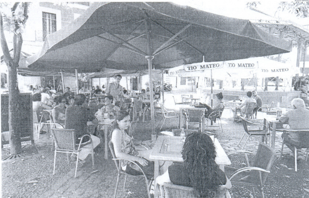
Pese a que el verano se presentaba complicado, los hosteleros han mantenido el ritmo del pasado año, lo que consideran "todo un éxito".

Eso sí, en el centro tienen claro que las mesas que se están sirviendo este verano tienen poco que ver con las de otros años. "La gente está más contenida y por ello se ven mesas con más tapeo o