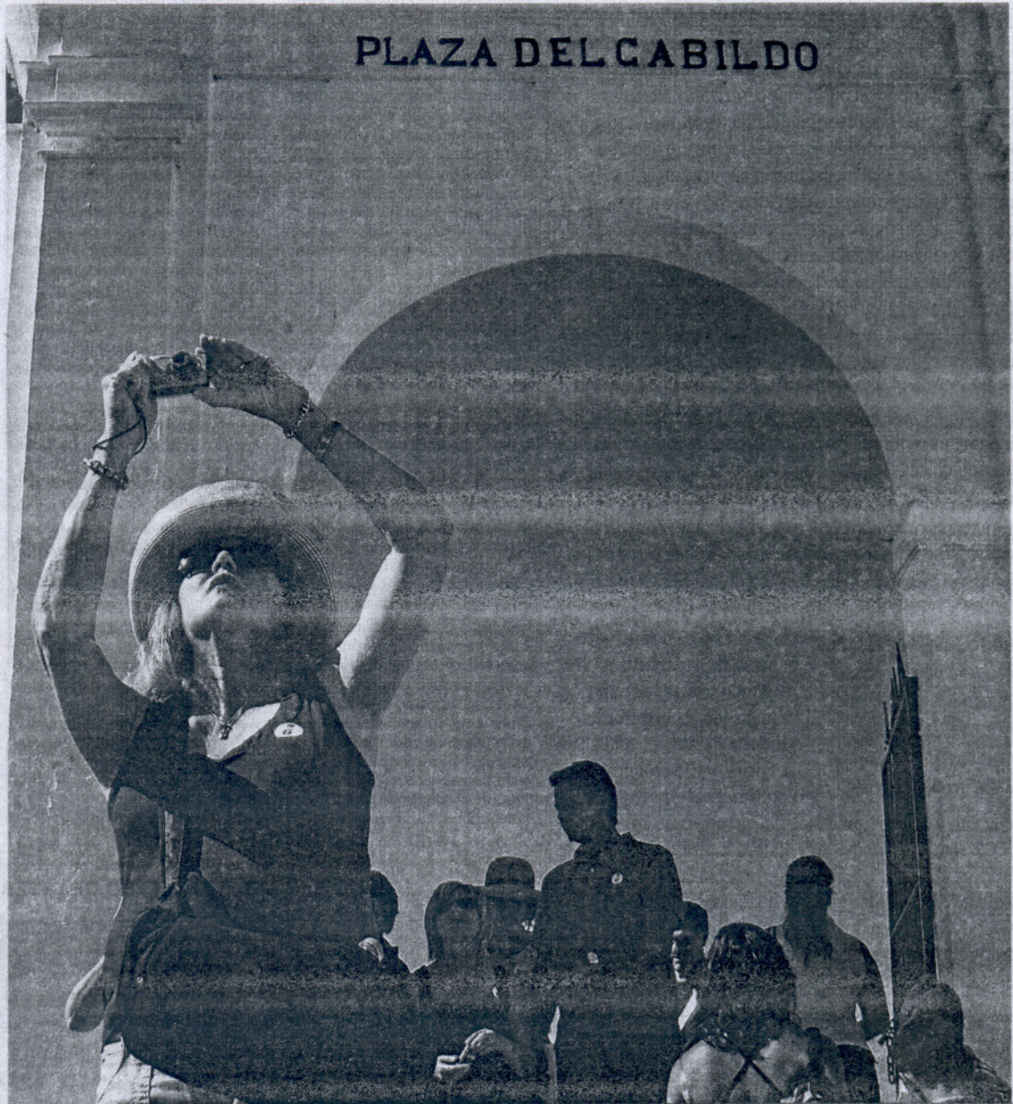
Un grupo de turistas en La Plaza del Cabildo de Arcos.