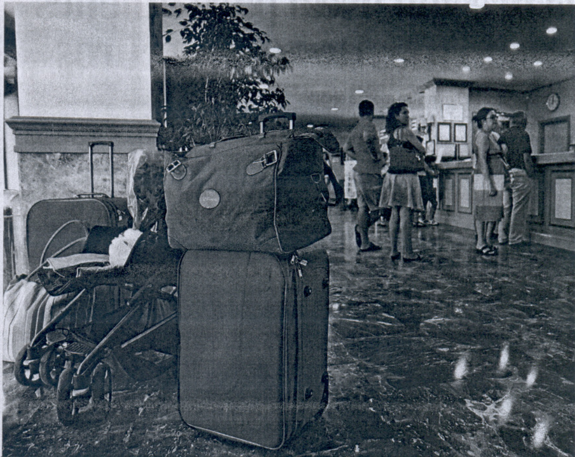
Clientes en la recepción del Hotel Atlántico en Cádiz.

"Todo el mundo tiene su lugar en Cádiz". Así lo afirmó el presidente de Horeca, la patronal de hostelería gaditana, Antonio de María. El 80% de los turistas son de origen nacional como viene siendo habitual, dentro del cual el 50% se corresponde con usuarios procedentes de Andalucía. El resto proviene fundamentalmente de Cataluña, País Vasco, Extremadura y Madrid. El otro 20% suelen ser alemanes, belgas y ho-