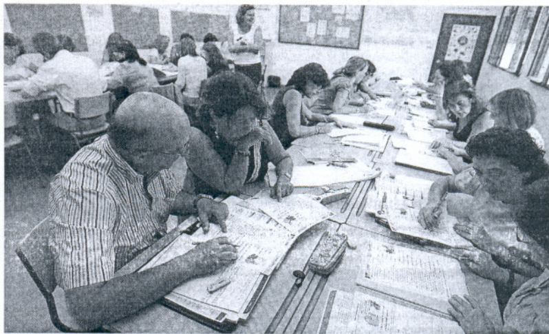
PREPARACIÓN. Alumnos en una clase de la Escuela de Idiomas.

La falta de apoyo y de equipamiento son las principales quejas de los educadores que imparten materias en distintas lenguas