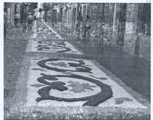
En la calle Charco, una alfombra de sal esperaba el paso de la patrona.