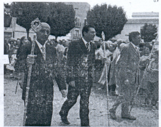
La Junta Local de Hermandades y Cofradías estuvo representada.