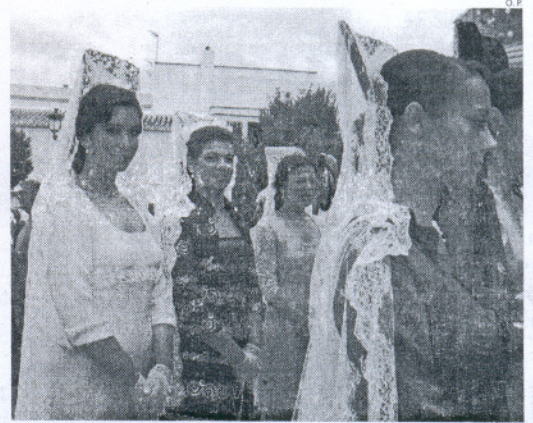
La Dama Mayor (de oscuro), junto a sus compañeras, lució la mantilla.