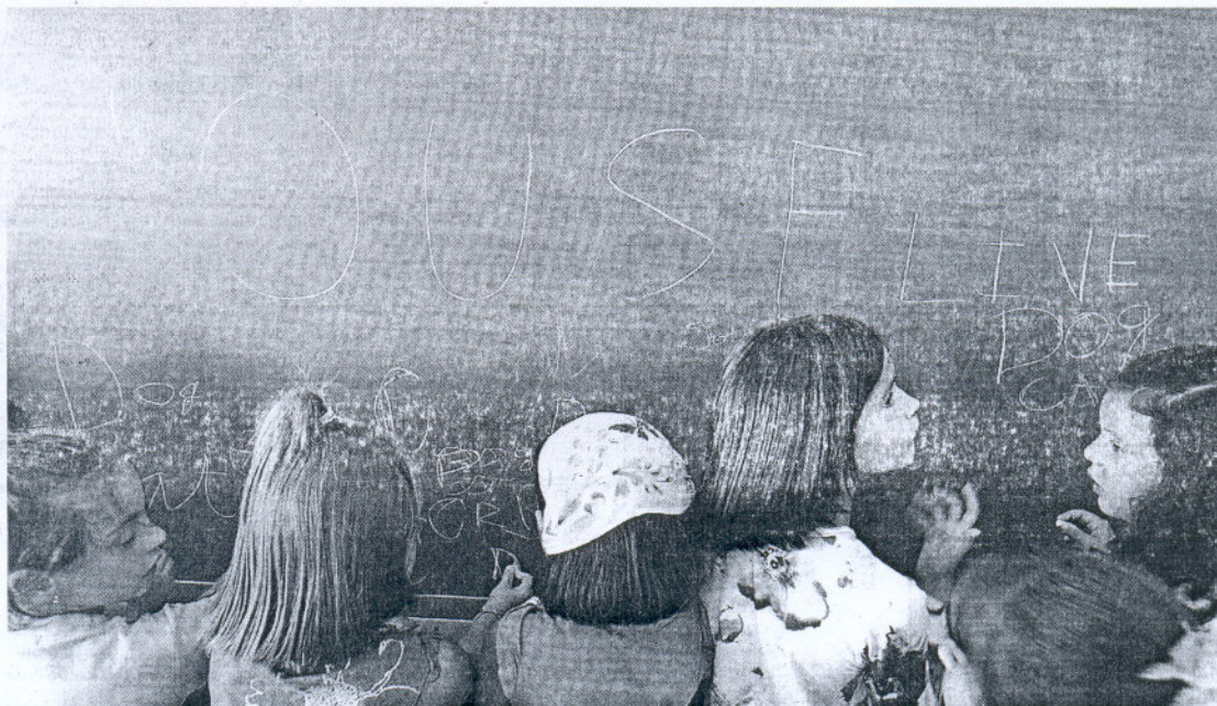
CAMBIOS. El modelo lleva más de diez años de forma experimental en la provincia.