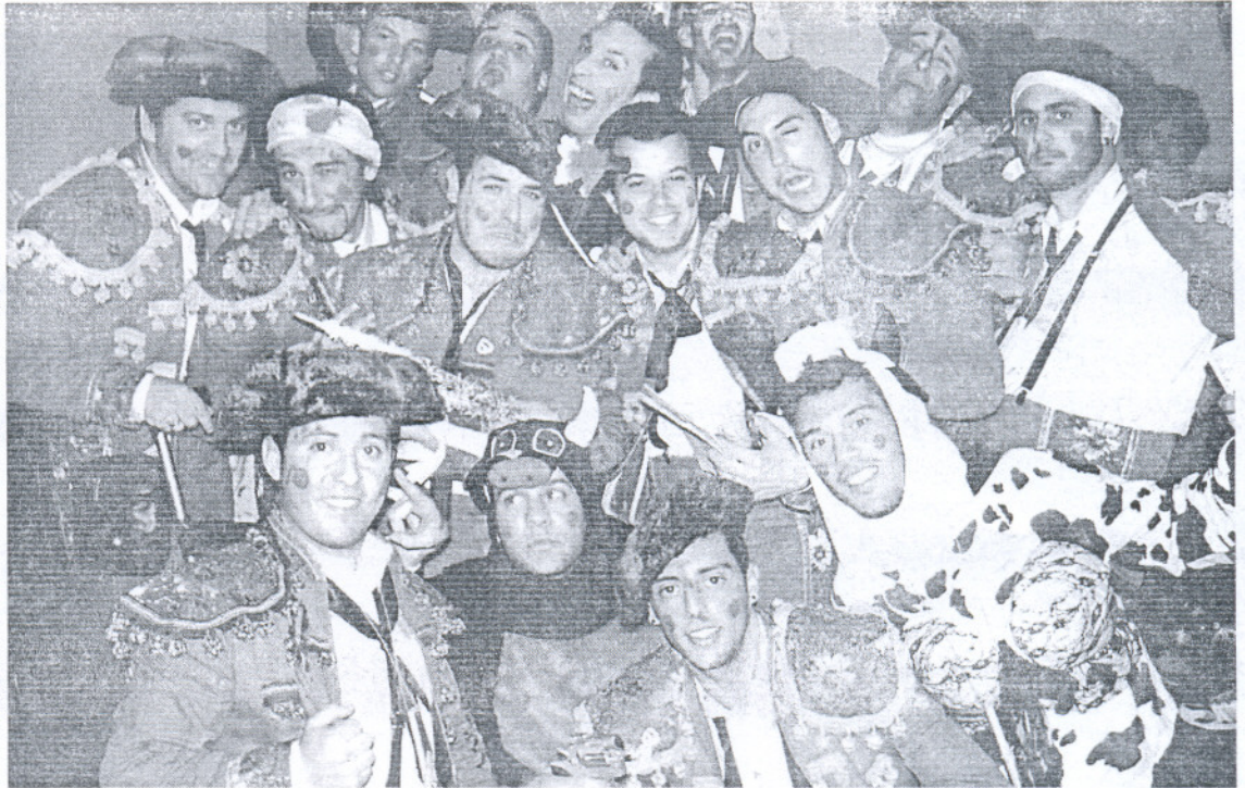
Componentes de la chirigota ilegal «Los José Tomal que por bien no venga»

Por tal motivo, y en aras de «corregir este agravio comparativo» con Huelva, le trasladamos a Chaves cerca de 2.000 firmas para que rectificara, pero le ha dado igual», concluyó.