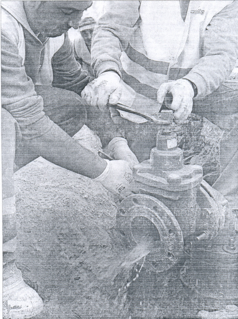
Operario trabajando en las obras de Emasesa de la calle Tigris de Sevilla.

El Acuerdo Andaluz del Agua, embrión de la futura Ley de Aguas, establece entre sus prioridades la necesidad de reducir al mínimo posible las pérdidas de agua en red, aunque será el Observatorio Andaluz