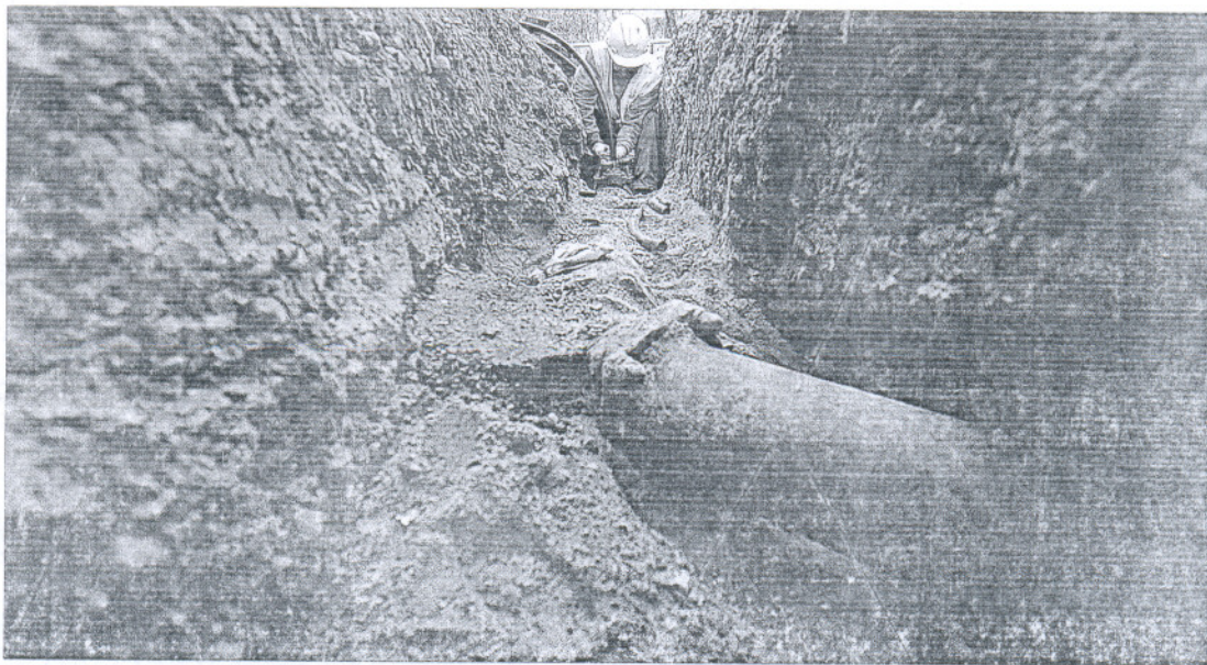
Obras de Emasesa en la calle Tigris de Sevilla.

El mármol de Almería se ha visto arrastrado también por la crisis de la construcción. Las cifras de los últimos meses perfilan un panorama desalentador. 1.200 trabajadores han perdido ya su empleo y un centenar de canteras ha tenido que parar por falta de pedidos. Empresarios, sindicatos y políticos buscan una salida y han constituido una mesa para afrontar el futuro. La patronal estima que son necesarios 150 millones de euros para intentar salvar este sector. PÁGINA 5