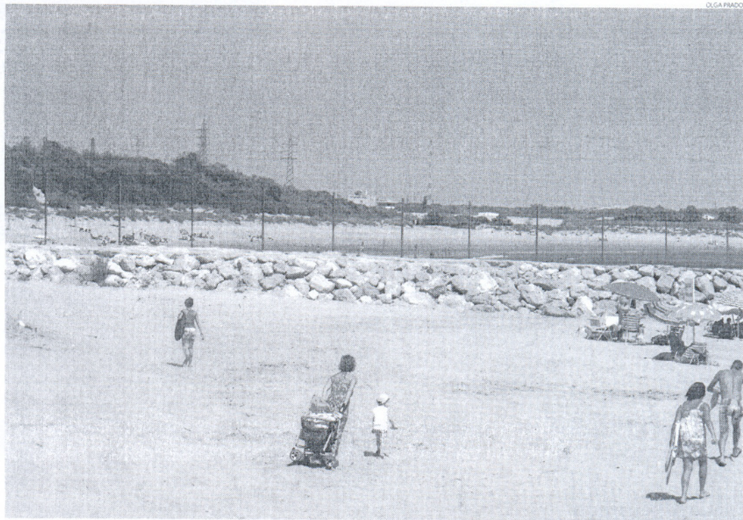
El armazón de la nueva valla que separa ambas playas, Galeones a este lado y el Almirante al otro, en la que pueden apreciarse numerosos bañistas.

Por otra parte, el grupo local de Ecologistas en Acción (EA), que preparaba una reunión para la noche de ayer enfocada a este asunto, confirmaba que ya hace cuatro días se reúnan con la asociación de vecinos de El Chorrillo, ya que la intención de los conservacionistas es realizar de nuevo