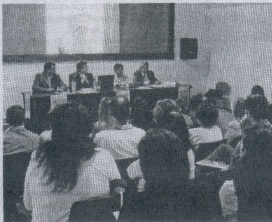
El Ayuntamiento y Faecta organizaron el encuentro celebrado ayer.

Sendos ediles gobernantes destacaron la relevancia de este encuentro refiriéndose al objetivo municipal de “dar a conocer los perfiles profesionales de los nuevos servicios que demanda la población con la aplicación de la Ley de Dependencia, para lo que son necesarios profesionales de cuidados y atención personal directa a los usuarios, es decir, cuidados con conocimientos de geriatría y discapacidad, así como auxiliares de enfermería; profesionales de alta especialización como médicos, psicólogos, trabajadores sociales, fisioterapeutas ocupacionales, personal de enfer-