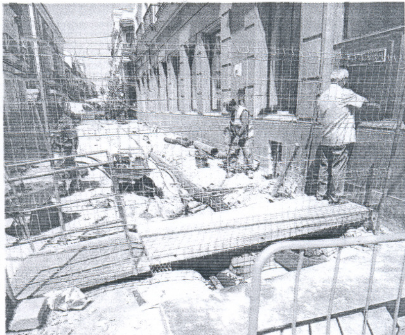
Obras en una calle de El Puerto.

La consejera recordó que los contratistas recibirán el pago por las obras antes de un mes tras la fecha de entrega y confió en que más pronto que tarde comience a notarse la generación de empleo que se le espera a este fondo autonómico que complementa al Plan 8.000 diseñado por el Gobierno central. Su departamento quiere