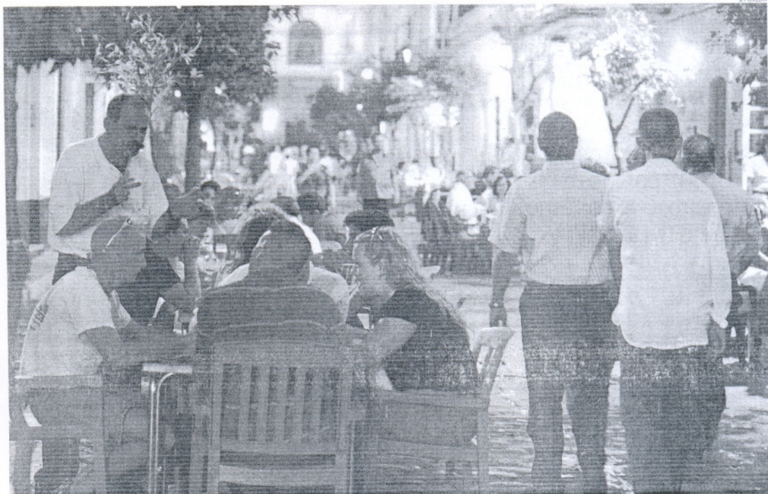
El sector servicios se lleva el gran batacazo en el conjunto de la Bahía con 646 parados más.

Cádiz y Rota pueden respirar. Febrero les da una tregua con descensos del paro, leve en la capital y más pronunciado en la locali-