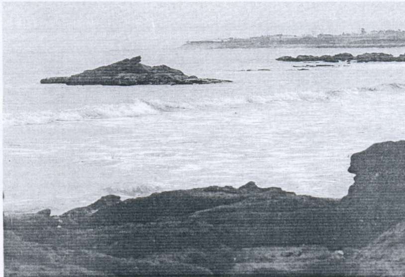
Imagen de la zona de Punta Montijo, en la costa de Chipiona.

El Gobierno asegura que pretende reparar este deterioro costero ya que sus intervenciones en la provincia son actuaciones blandas que consisten en la aportación de arena a las playas que lo necesitan. Dentro de esta medida habitual, Espinosa señala que el departamento al que representa "aportará arena del fondo marino o terrestre para las playas que la precisen, siempre y cuando éstas cumplan con los objetivos marcados por el Ministerio. Por otro lado, en las zonas con incidencia de transporte eólico, asegura que se colocarán tablaestacas de maderas, captadores de mimbre y plan-