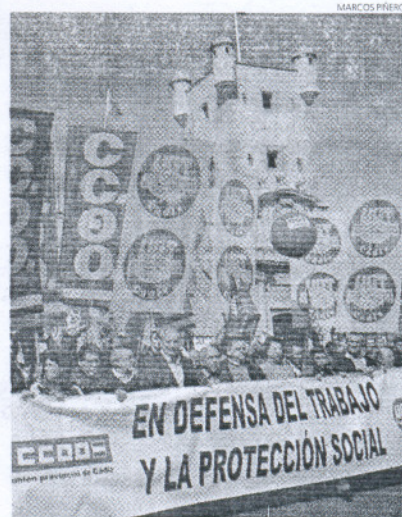
CCOO y UGT se movilizaron ayer por la crisis.