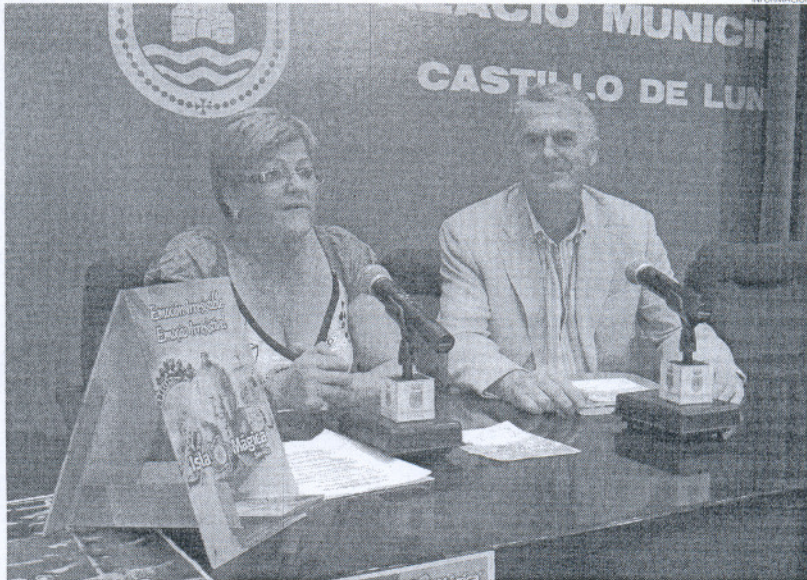
La edil de Turismo y el director general de Isla Mágica animaron a los ciudadanos a asistir a esta actividad.

Por otro lado, aquellas personas que deseen desplazarse por su cuenta hasta el parque temático tiene la posibilidad de adquirir