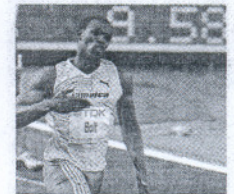
Histórica carrera de Bolt.

Usain Bolt gana en el Mundial y deja el récord de los 100 metros en 9,58