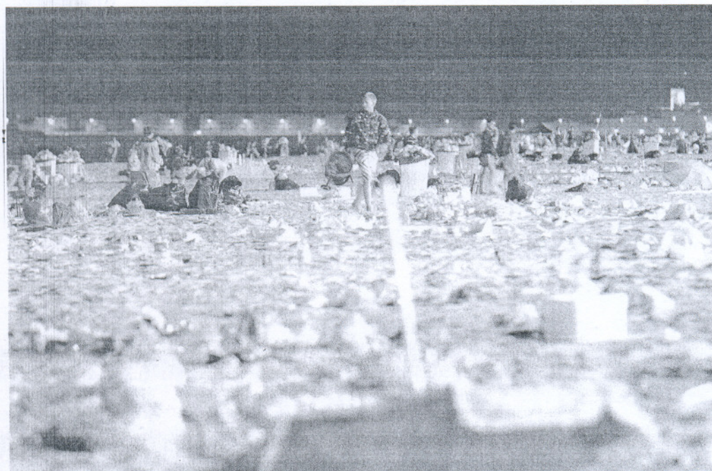
Estado en el que se encontraba la playa de la Victoria de Cádiz sobre las seis y media de la mañana de ayer tras las barbacoas.

Suceso Un joven sevillano de 24 años resulta muerto tras autolesionarse mientras participaba en el festejo