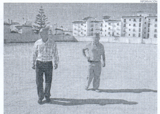
Este nuevo parking desahorará la zona de la avenida San Fernando.

El uso de este solar como parking se acordó entre el Ayuntamiento y la empresa Urbis, que tiene previsto en un futuro construir en estos terrenos, a través de un convenio de colaboración que firmaba hace unos días el alcalde de Rota y por el que la citada empresa ha cedido este solar para que el Ayuntamiento acondicione plazas de aparcamiento.