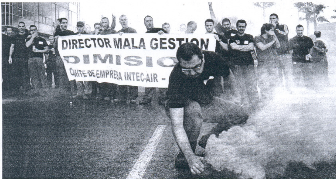
Los trabajadores de Intec-Air, ayer durante el corte de carretera en Zona Franca.