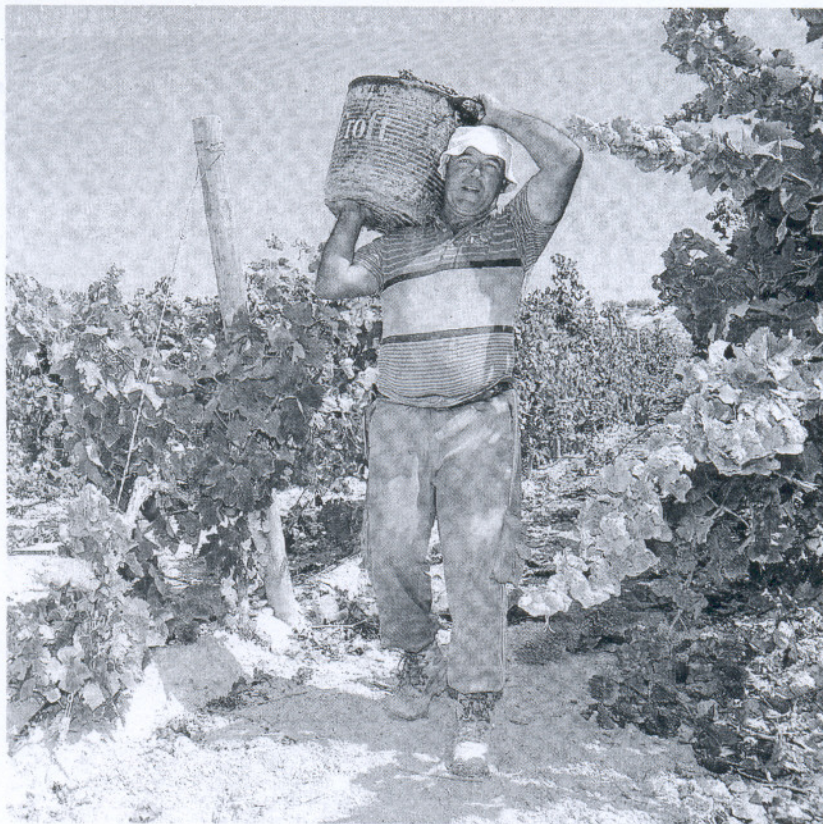
CAMPAÑA. Un jornalero recogiendo uva, durante la pasada vendimia del Marco. / CRISTÓBAL

4 Los productos complementarios. Es algo de lo que se habla especialmente en los últimos meses, ya que buena