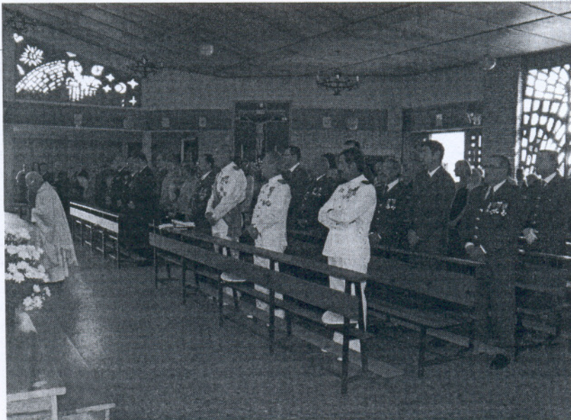
En la Iglesia del Carmen se celebra tradicionalmente la misa en honor de la Guardia Civil y de la Virgen del Pilar.

En la misa conmemorativa, el párroco de la Iglesia del Carmen quiso hacer un reconocimiento