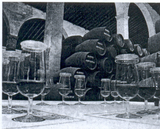
DOCUMENTO. El reglamento es necesario para el sector. J. C. C.

La Consejería de Agricultura se ha ido reuniendo en las últimas semanas tanto con las organizaciones agrarias como con el Consejo Regulador de los Vinos de Jerez, que es donde se aprueba el texto. El tema de los productos complementarios es uno de los principales asuntos que había que resolver, teniendo en cuenta que la última propuesta no incorporaba la «obligatoriedad» del uso de la uva del Marco de Jerez para la elaboración de los mismos.