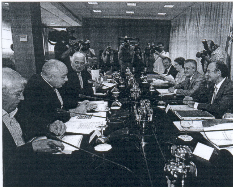
Reunión del pacto de concertación con Gobierno, empresarios y sindicatos.

Estos 235 millones está previsto que se apalanquen hasta alcanzar los 455 millones de euros a través de aportaciones de terceros —las cajas andaluzas ya ha se han comprometido a aportar un total de 70 millones de euros al fondo—, y supondrá una inversión inducida de más de 1.300 millones de euros.