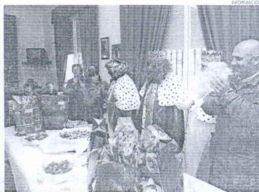
Los Reyes en Rota también se acordaron de los mayores.