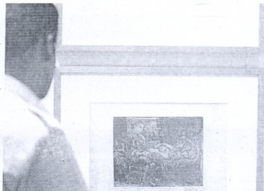
ESTRELLA. Grabados de Picasso, en una exposición en París.

Si en el primer período realiza apuntes y dibujos, crónica irreverente y autobiográfica de su juventud, en los grabados de su última época se puede constatar una gran variedad de encuadres, de perspectivas, de técnicas de representación que confieren tal fuerza a las imágenes representadas que convierte al espectador en el voyeur al que está destinada la escena. Con esta muestra se renovará la presentación de las nuevas salas de grabado del museo, que abrieron a principios de 2008 con la propuesta Picasso, linograbador . Una gran retrospectiva del pintor Joaquim Mir, con un centenar de obras, abrirá la temporada 2009 de CaixaForum