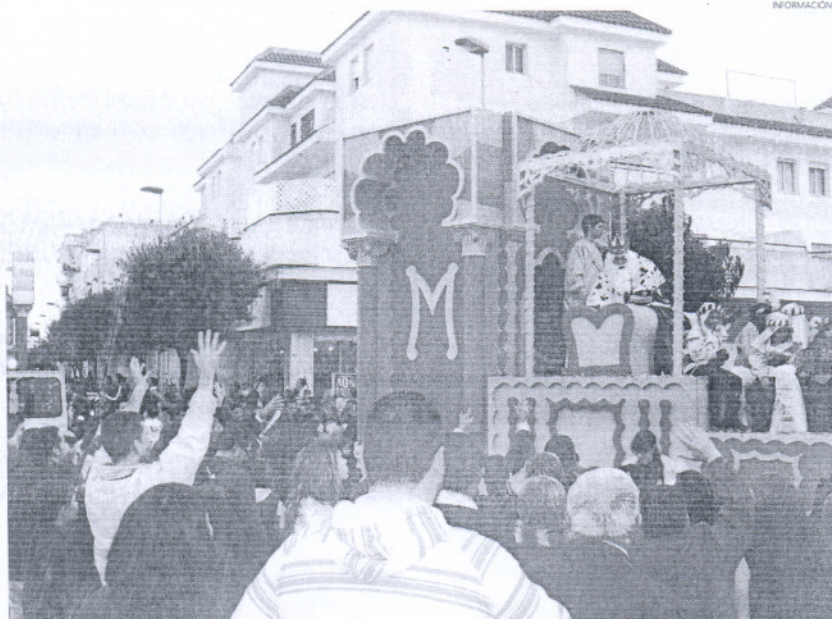
En Rota el cortejo contó con la presencia de numerosos niños.

despertar. Mientras, queda la ansiada espera tras haber visto en las calles a los tres Reyes Magos de Oriente y a todo su cortejo.