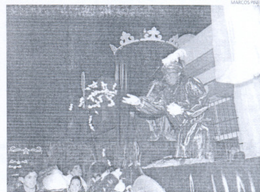
El Rey Baltasar repartiendo caramelos en Puerto Real.

Miles de niños salieron a la calle en ambas localidades