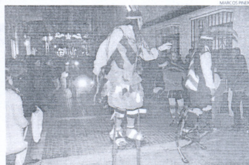
Los zancudos con sus cabreolas, en el cortejo de Puerto Real.