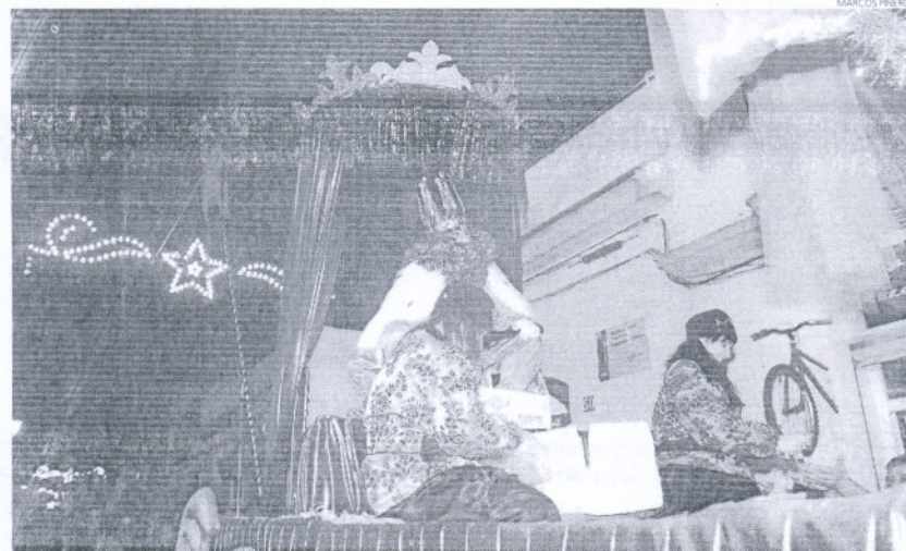
La Cabalgata en Puerto Real recorrió las calles más céntricas con los Reyes.