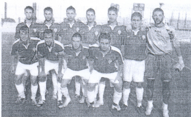
El Portuense juvenil (Liga Nacional) no pasó del empate en el José del Cuvillo.