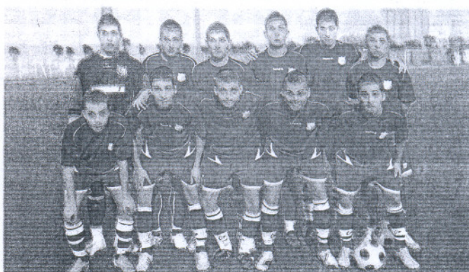
El Algaída juvenil vendió cara la derrota en el Manuel de Irigoyen.