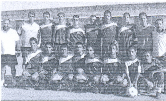
Hombrada de La Salle PR B juvenil (en la imagen), que venció al Vejer Balompié.