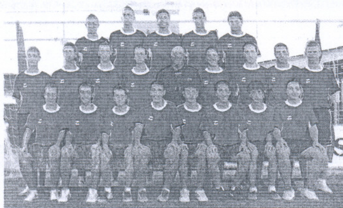
Los juveniles de la Roteña sumaron una meritoria victoria para huir de las plazas de descenso.