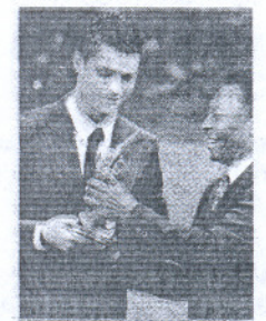
Ronaldo recibe el premio.

Ronaldo gana el FIFA World Player por delante de Messi y Torres