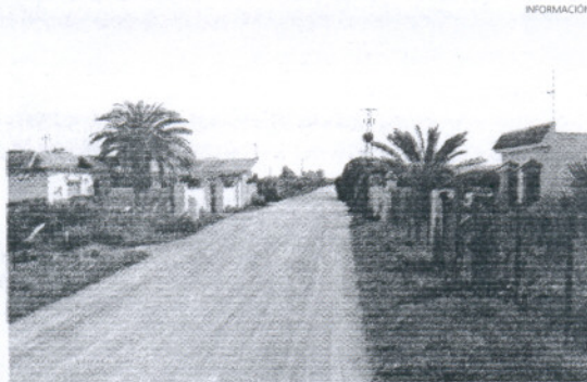
Aguadulce es una asignatura pendiente de la Administración local.

Tal y como explicó la proponente, la Comisión Provincial de Urbanismo de la Junta de Andalucía ha aprobado la ampliación