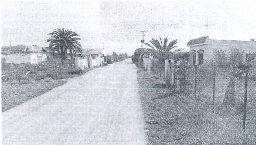
SITUACIÓN. Vista general de una de las zonas del sector de Aguadulce, a las afueras de Rota.

Antonio Peña, en representación del PP, discrepó con el concejal de IU y le aseguró que Rota no se parece en nada al resto de