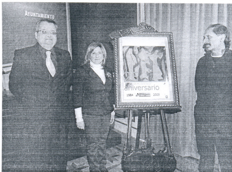
El presidente de Juventudes Musicales, la alcaldesa y el autor del cartel conmemorativo junto a la obra.