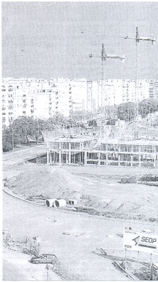
Edificios de viviendas en construcción en Sevilla.

Tras aquel encuentro, el presidente de la FACA negó que se estén endureciendo las condiciones en la concesión de crédito y que se aplican los mismos criterios que años anteriores, aunque admitió que tal vez exista una mayor cautela ante el riesgo de impagos, algo que se comprometió a revisar.