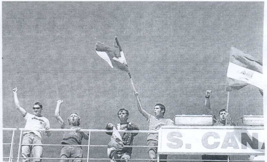
CUBIERTA. Unos 50 manifestantes permanecieron en la cubierta superior del 'Super-Fast Canarias'