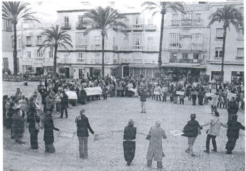
Los colectivos de mujeres han lamentado las críticas del Consejo Local de Hermandades a la Ley del Aborto.