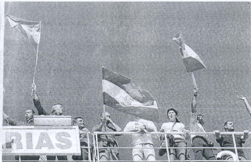
durante una hora hasta que desembarcaron voluntariamente.

Detienen a un constructor chiclanero por irregularidades urbanísticas en El Puerto.