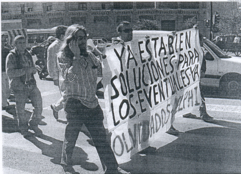
Una representación de ex eventuales acudirá el lunes a Sevilla para participar en la reunión.

Asimismo, se mostraron "muy satisfechos" porque esta será "la primera vez" que traten directamente con la Junta de Andalucía para abordar su situación, recordando que lo que reclaman es "so-