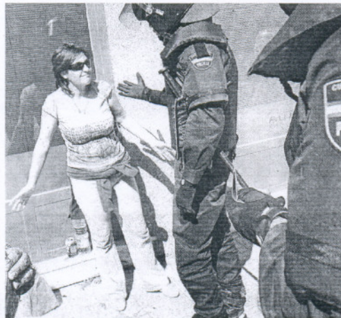
CARGA. La tensión provocó la actuación policial.