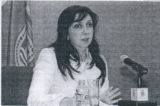
La delegada se siente satisfecha del Carnaval a pesar de las críticas.

Una programación que según ha explicado la delegada, se elabora de forma consensuada con los diferentes sectores implicados como son las agrupaciones, las AMPA de los colegios, las peñas y entidades, con las que se iniciaron los trabajos de preparación el pasado mes de octubre. "La fiesta la hace el pueblo porque si la