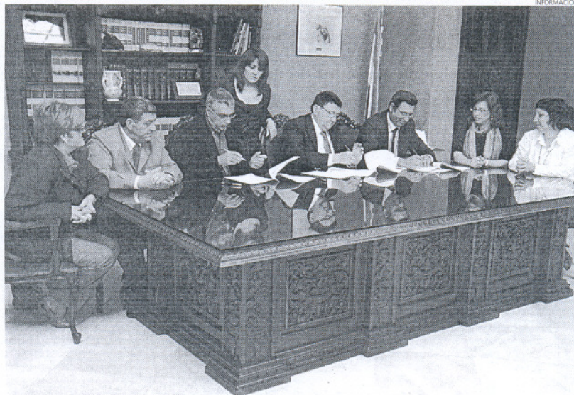
El alcalde rubricó con el representante de Defensa el convenio para la expropiación de 900 metros cuadrados.