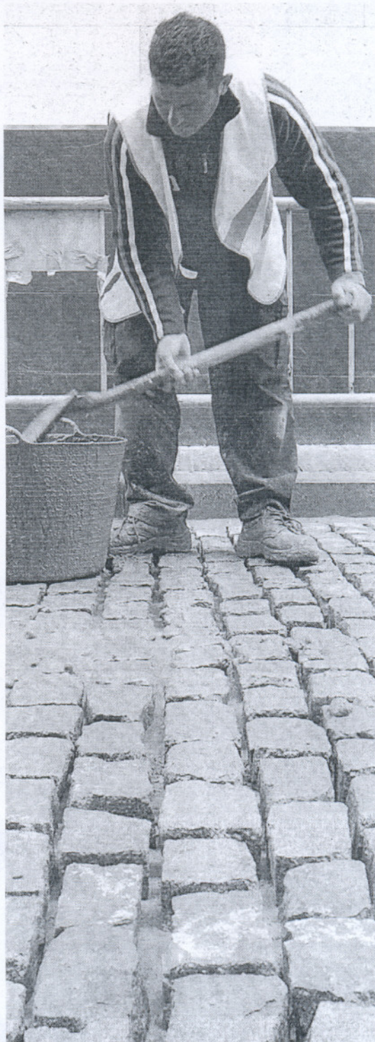
PICO Y PALA. Un trabajador, en las calles de Cádiz.

Adiós a la felicidad: a fecha de abril de 2009, todos los sectores (excepto la agricultura, que a primeros de año vive su particular