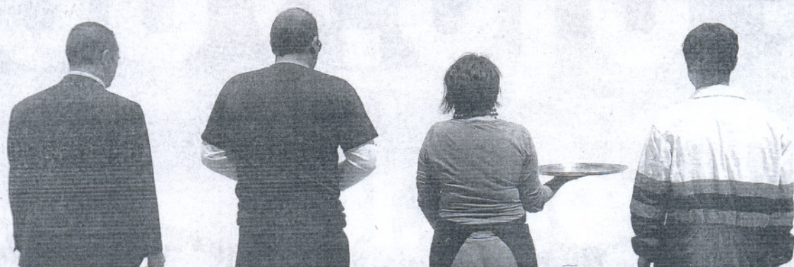
AFFECTADOS. Cuatro trabajadores de distintos sectores productivos contemplan una pared en blanco.

La cifra de afectados y la destrucción de empleo en un trimestre baten récord históricos