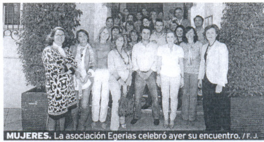
MUJERES. La asociación Egerías celebró ayer su encuentro.

en Octubre del 2004, «con la idea de ser un foro abierto de debate con ideas innovadoras dentro del turismo, y desde la visión profesional de quienes llevan muchos años en esta actividad, y también de las nuevas generaciones». Además, temas como la conciliación de la vida laboral y familiar, el empleo en precario entre mujeres, y las discriminaciones de género son algunos de los temas que centran los debates de este grupo de profesionales.