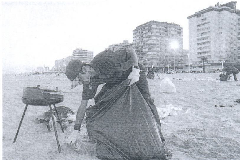
LIMPIEZA. Imagen de las labores de limpieza tras la noche de las barbacoas en la Playa Victoria.

En el caso de Rota, que lleva varios años presentando unas actuaciones bastante completas, el presupuesto crece porque se centra más en compras de maquinaria para limpiar la arena, «en cambio, hay