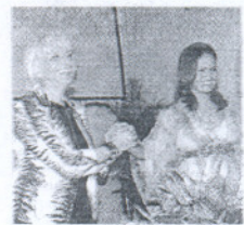
Martínez y Pinedo.

Las ciudades de Cádiz y Cartagena de Indias sellan su hermanamiento