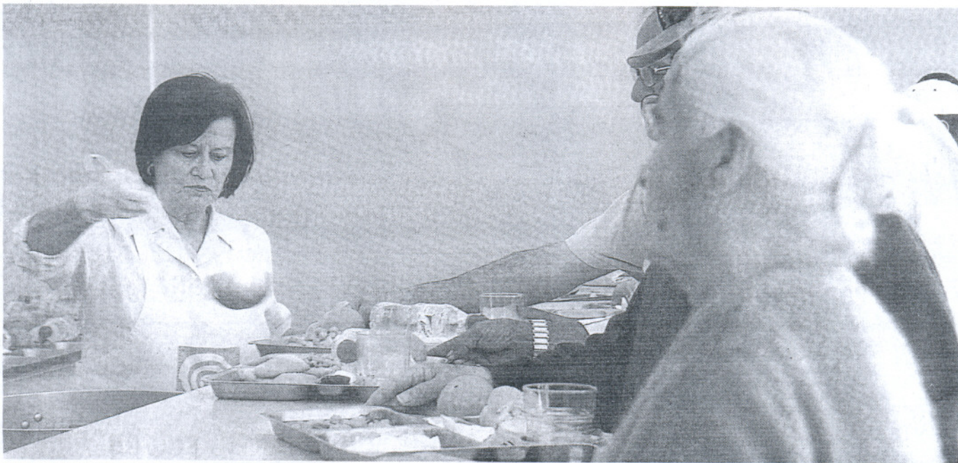
PRIMERA NECESIDAD. Los usuarios se ponen en fila para llenar la bandeja en el comedor El Pan Nuestro de San Fernando. /c.c.