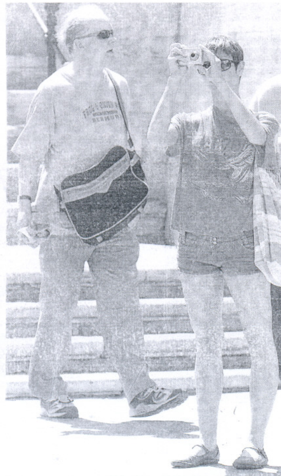
Visitantes en la plaza de la Catedral.

los visitantes son principalmente de procedencia nacional, las perspectivas para los próximos meses no se han visto afectadas por la previsión de descenso del 10% de turismo extranjero que avanzó el secretario de Estado de Turismo, Joan Mesquida, hace unos días. Si los paquetes vacacionales contratados por éstos en Cádiz se han visto reducidos, su hueco ha sido ocupado por huéspedes españoles.