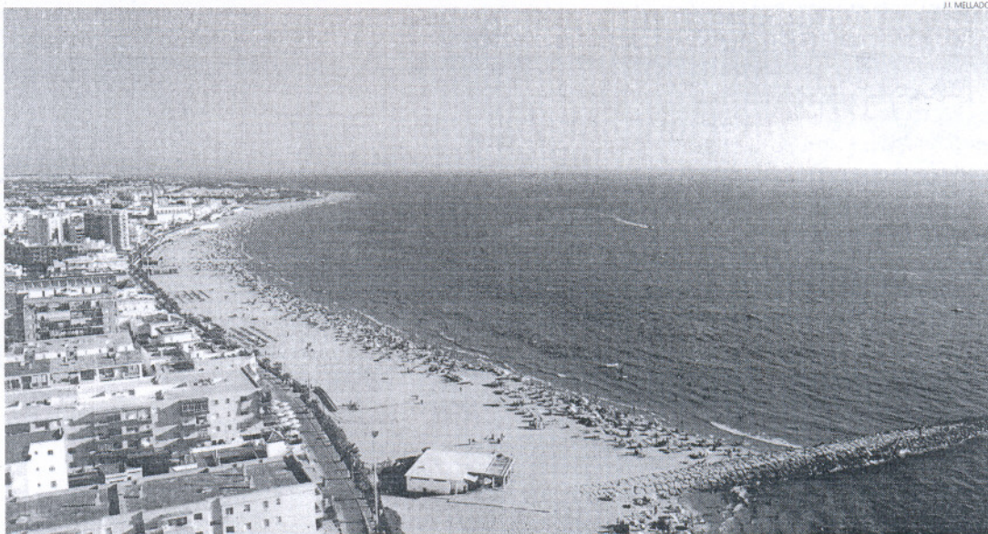
Panorámica de la playa de Regla --a 8,5 kilómetros de la cual está prevista la instalación de los molinos-- desde el Faro y con el Santuario al fondo.