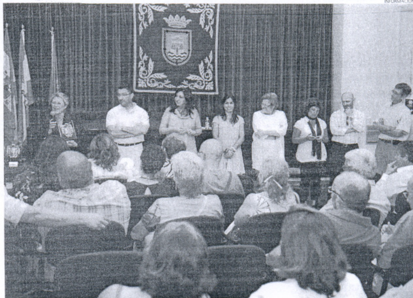
La comunidad educativa de la Villa se dio cita en el Castillo de Luna para celebrar el fin de curso 2008/2009.

Para finalizar, la delegada explicó que este acto, que tradicionalmente se ha venido haciendo con una convivencia coincidiendo con la fecha de los patronos de los docentes, se ha modificado en