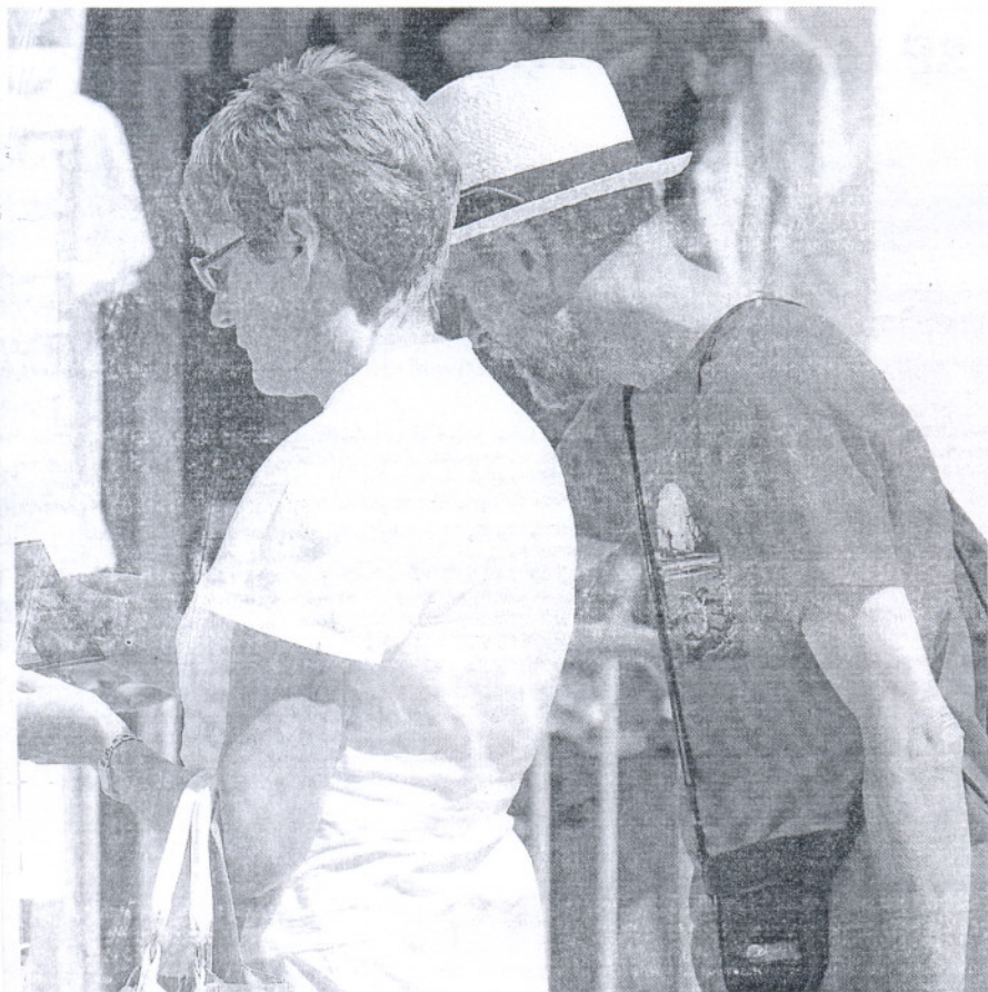
puestas a la venta en un comercio.

7 Economía La planta de Kraft en Mahón quedará hoy integrada en Nueva Rumasa