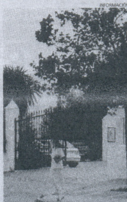
Residencia El Santísimo.

También ha detallado que consistirá en la evaluación del reclutamiento (individuos que acaban de incorporarse a la pesquería) para las especies de boquerón y sardina, así como la evaluación y cartografiado de la distribución de los cardúmenes de estas especies en el área de estudio.