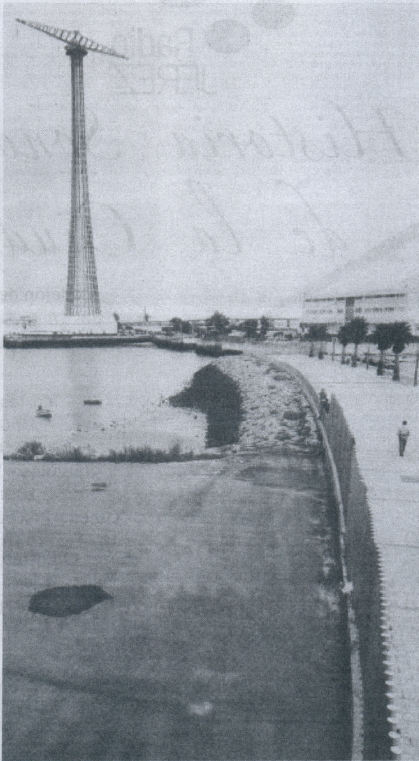
REFORMA. Parte de la rehabilitación del paseo de Puntales se hizo con cargo al PlanE.