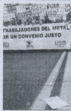
Marcha en Logroño. E. MANZANARES

res, Guadalajara, León y Segovia) si bien en un principio ésta estaba convocada en un total de 19. Los acuerdos alcanzados en los últimos días con los empresarios permitieron que el paro se desconociera en diez de ellas (Cáceres, Burgos, Madrid, Pontevedra, Huesca, Zaragoza, Murcia, Huelva, Cádiz y Málaga). Hasta el pasado 14 de octubre, día en que se convocó la manifestación, estaban pendientes convenios que afectaban a unos 400.000 trabajadores del sector.