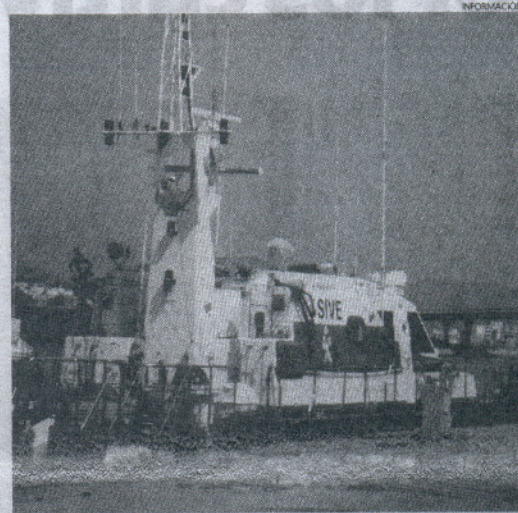
La vigilancia del Estrecho de Gibraltar es una prioridad del Gobierno.