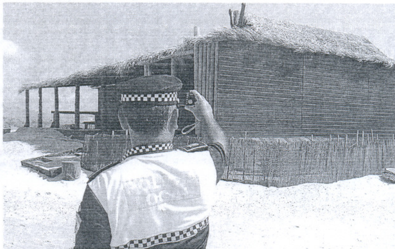
Un policía local supervisa un chiringuito en el litoral tarifeño.

Durante el debate no faltó ni la opinión de un experto en Gestión