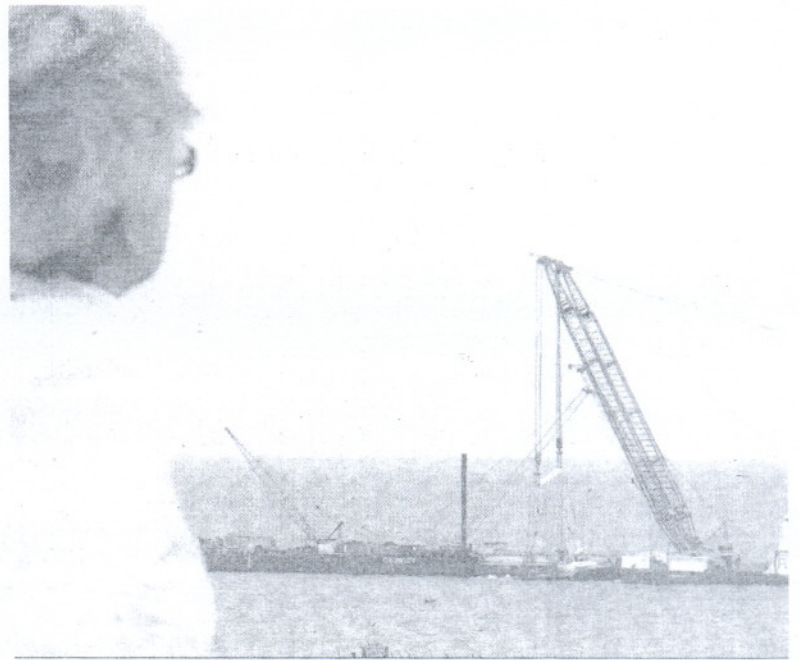
Una grúa trabaja en el 'New Flame' en Punta Europa.

Conil es junto con Cádiz, Chiclana o El Puerto uno de los destinos prioritarios de los jóvenes en temporada estival. El Ayuntamiento de Conil instala cada año en el paseo marítimo unas carpas que se suman a la amplia oferta de bares y discotecas de la localidad. Altercados como éste suelen ser frecuentes en esta zona a altas horas de la noche, coincidiendo con el horario de cierre.