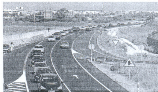
Caravana de protesta de vecinos en dirección a Rota.