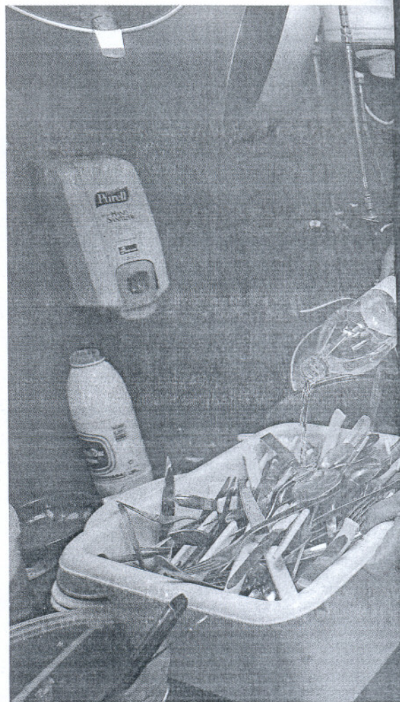
La hostelería seguía ayer sumida en el caos y se valía de botellas para limpiar.

Estas "sospechas" y la cuarta jornada de cortes e "hilos" de agua colmaron la paciencia de dos centenares de vecinos, que ayer marcharon en una caravana de coches hasta Rota y protestaron ante el Palacio Municipal Castillo de Luna, donde un cordón policial les bloqueó el paso a la Casa Consistorial. Desde la calle, niños y mayores lanzaron sus reivindicaciones de agua sumergidos en una mezcla de incredulidad, desubicación e impotencia: forasteros, 10 de agosto, mediodía, un día de sol y brisa y "vetados en la casa del pueblo", según la crítica unánime. Finalmente, una representación