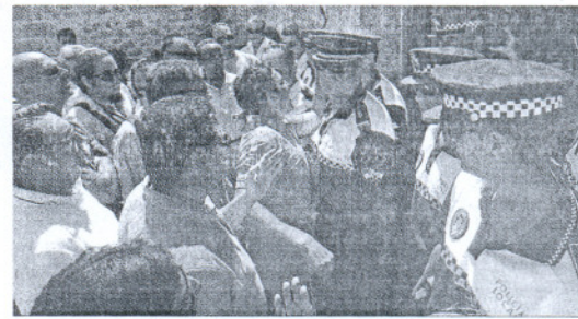
Un cordón policial impidió la entrada de los manifestantes al consistorio.