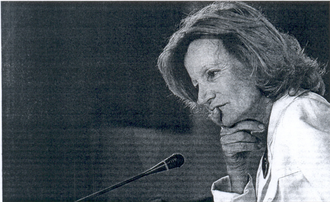
La ministra Elena Salgado, durante la rueda de prensa ayer en Madrid.