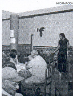
Los mayores en el centro de día.

rrales, quiso compartir con los mayores parte de la exhibición que ofrecieron miembros del taller y en la que pusieron en práctica malabares con bolas, diablos o pelotas.