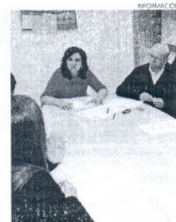
La edil se reunió con las damas.

vos navideños que la protagonizan. Una labor, en la que la delegada de Fiestas, ha querido destacar la colaboración de todas y cada una de estas chicas, niñas y niños, así como de sus familias.