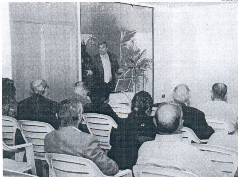
Las jornadas han tenido un gran nivel de público interesado en informarse más sobre este tema de actualidad.

La primera de las jornadas se celebraba el mes pasado, concretamente el viernes 27 de noviembre con la ponencia 'Problemática de los combustibles fósiles; Fu-