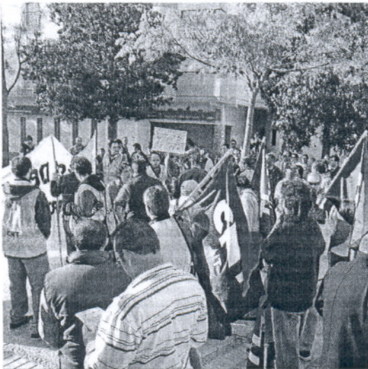
Un instante de la manifestación celebrada el pasado lunes.

Representantes del sindicato aludido y de la plataforma, que asegura aglutinar a más de 150 desempleados de la ciudad, se reunieron de nuevo el pasado viernes con el alcalde, Lorenzo Sánchez, para informarse del seguimiento municipal de sus reivindicaciones. Entre éstas figuran "un reparto justo y rotativo del trabajo generado por las obras públicas", "transparencia y control de las contrataciones de personal", "la eliminación de las horas extraordinarias en Rota" y la consignación de "más dinero público para servicios sociales y la creación de empleo en los próximos presupuestos municipales".