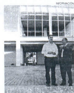
El edificio está casi terminado.

Corrales se ha mostrado muy satisfecho, no sólo porque los plazos de ejecución de la obra se están cumpliendo y se espera que esté acabada para finales de año, sino porque se cumple el objetivo del equipo de Gobierno de ir desarrollando todas las parcelas dotadas ubicadas en Costa Ballena, dando servicios a los ciudadanos y vida a la zona.