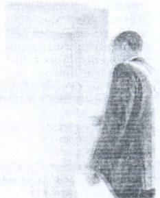
Obama entra en su despacho.

Obama ordena paralizar los juicios que se celebran en Guantánamo