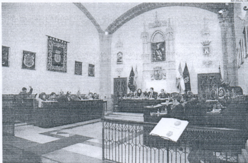
Todos los grupos coincidieron en la necesidad de la creación de esta figura educativa en los centros locales.

que tuvo este apoyo para los más pequeños, para los propios profesores y para los padres y madres de los alumnos, el equipo de Gobierno puso manos a la obra para que las auxiliares de apoyo a la infancia permanecieran trabajando en los colegios hasta final de curso.