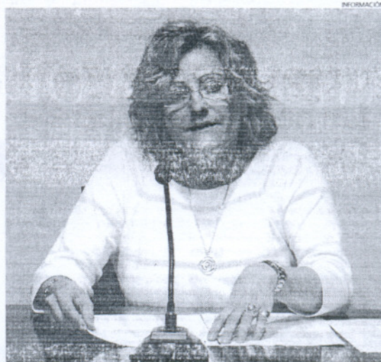
El curso comenzará el próximo mes de febrero y se extenderá hasta agosto.

El programa de contenido abarca desde la organización de los recursos materiales en una unidad/estancia, la comunicación y la atención al paciente, los cuidados básicos y terapéuticos de geriatría, o la atención especializada al anciano, entre otras materias. Mañana termina el plazo de presentación de solicitudes.