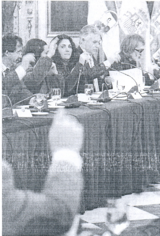
Los diputados provinciales, en la votación de ayer.

Por su parte, IU no encontró el apoyo ni de PP ni de sus socios del PSOE para su moción para pedir la "paralización inmediata" de la aplicación de las reformas del llamado Plan Bolonia en el sistema universitario, que sólo respaldó el diputado andalucista.