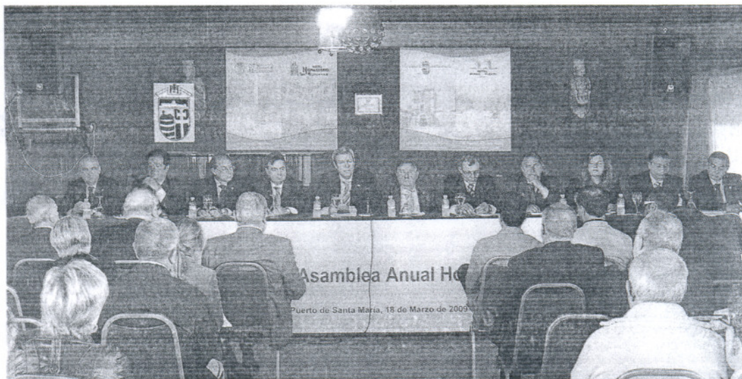
La junta directiva de la patronal de hostelería Horeca rindió cuentas ayer a sus asociados en la Hacienda Las Beatillas, en El Puerto.

La patronal de hostelería pide a los ayuntamientos y al Gobierno andaluz que "se pongan del lado del sector" • "Tenemos que aprovechar la crisis para poner la casa en orden", subraya el presidente