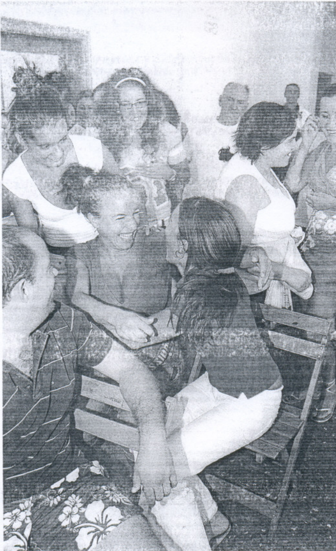
Algunas agraciadas con una vivienda de Diputación en Alcalá del Valle celebran su suerte.