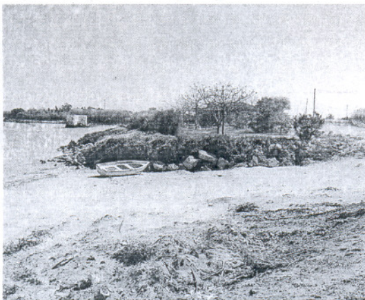
La playa chipionera de Micaela, situada junto al puerto deportivo.

Atribuye la "desaparición de arena" a las obras que la Junta de Andalucía está ejecutando con el fin de "construir un tercer acceso a Chipiona por la carretera de Los Granadillos, con la desorbitada