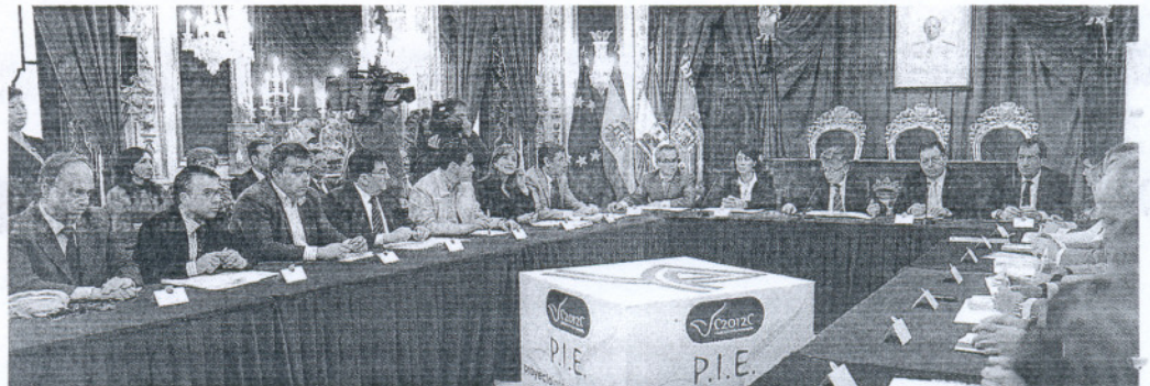
Imagen de la firma del Plan Integral de Empleo en Diputación.

EL PLAN CÁDIZ 2012 COMPITE YA HA LOGRADO FINANCIACIÓN EUROPEA PARA TRES PROGRAMAS POR VALOR DE 67 MILLONES