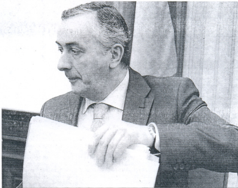
El secretario de Estado de Hacienda, Carlos Ocaña, ayer tras la presentación de la contabilidad nacional.

Los ingresos por cotizaciones sociales sumaron en los dos primeros meses un total de 17.504,9 millones de euros, un 2% menos que en el mismo pe-