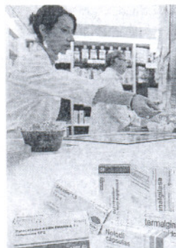
Una farmacia de la provincia.