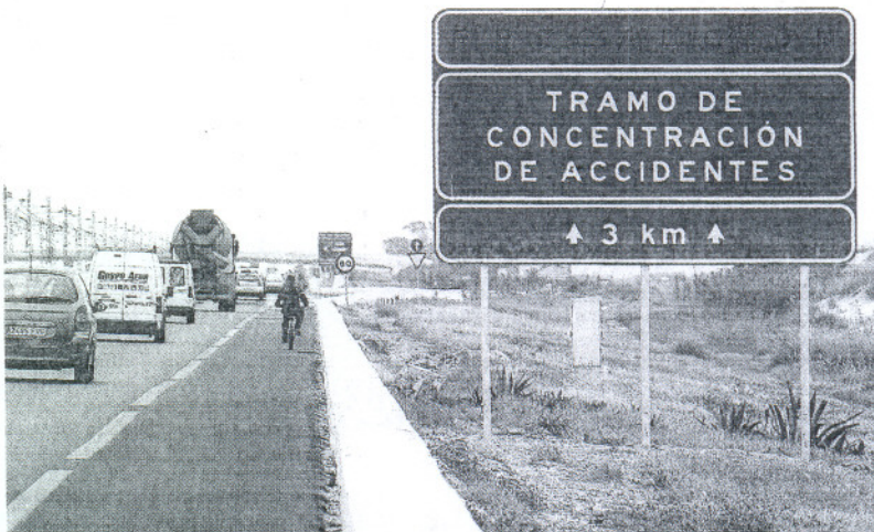
Señal que previene del TCA del curva de Torregorda, en la CA-33.

En la provincia se han identificado nueve TCA, cuatro de ellos en la N-340