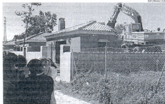
El fiscal de Medio Ambiente aboga por las demoliciones.