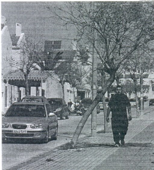
La urbanización portuense de El Tomillar verá mejorado su acerado.

Entre los proyectos para los que se ha autorizado el libramiento de fondos, destacan los 10 proyectos de Rota, que han recibido más de 3 millones de euros para infraestructuras en el municipio. El resto de proyectos se distribuye de la