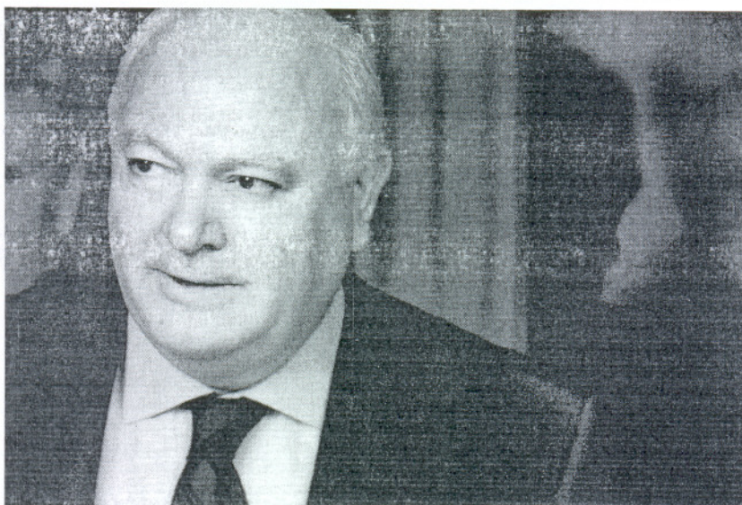
El ministro Moratinos, el miércoles, en el Congreso de los Diputados

UNA CARRERA DE CINCO MESES PARA QUE PUEDAN VOTAR EN LAS MUNICIPALES