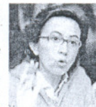
CONSEJERA DE OBRAS PÚBLICAS

La escasa ejecución presupuestaria de los planes de infraestructura de la Junta de Andalucía, denunciada esta semana por las empresas del sector, no ayuda, en tiempos de crisis, a crear empleo, la prioridad esencial de cualquier gobierno.