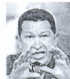
PRESIDENTE DE VENEZUELA

Apelar, siquiera de forma retórica, a una posible guerra en la última cumbre celebrada por los países suramericanos por su desacuerdo con el Gobierno de Colombia es una conducta inadmisiblemente para un gobernante al que ciega el populismo.