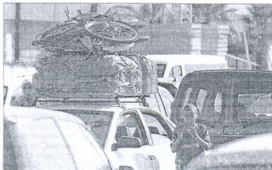
Espera para embarcar y cruzar el Estrecho, ayer en Algeciras.

El cuerpo sin vida del senderista de 18 años, que desde el pasado día 11 de agosto estaba desaparecido en la costa de Tarifa (Cádiz), fue encontrado en la mañana de ayer. El hombre, natural de Ceuta, se despenó desde un acantilado en la zona de Punta Carnero. Tras cuatro días de búsqueda por parte de los equipos de rescate, fue su hermano quien ayer encontró el cuerpo sumergido en una zona de rocas, próxima al lugar en el que el joven desapareció el martes pasado. El cadáver fue trasladado hasta las dependencias del servicio marítimo de la Guardia Civil en el Puerto de Algeciras, desde donde fue conducido al Instituto Anatómico Forense de Cádiz, donde se le realizará la autopsia.—C.R.