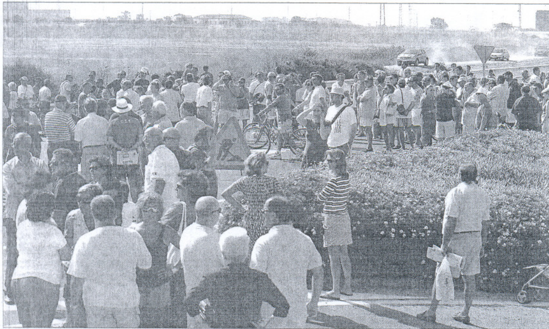
Protesta de los propietarios de Costa Ballena por los cortes de agua, la semana pasada en Rota (Cádiz).