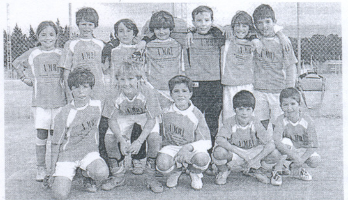
El Lestonnac benjamín continúa completando una temporada excepcional.