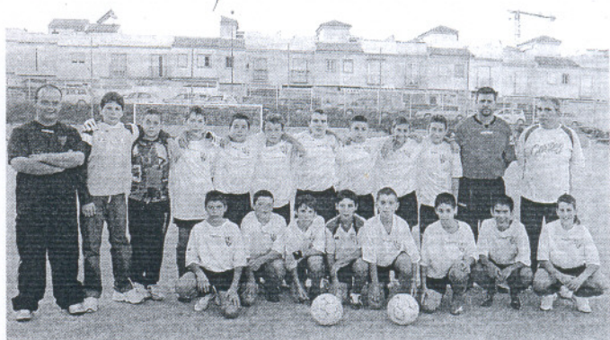
La Roteña B infantil disfrutó de un partido bonito entre conjuntos de la misma localidad.