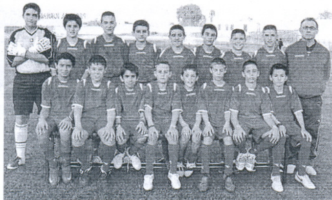
Los infantiles del Divina Pastora Sanluqueña B, sin opción a dar la sorpresa.

SI DESEA COLABORAR MANDE SU FOTOGRAFÍA A deportes@diariodecadiz.com CON LOS DATOS DEL EQUIPO