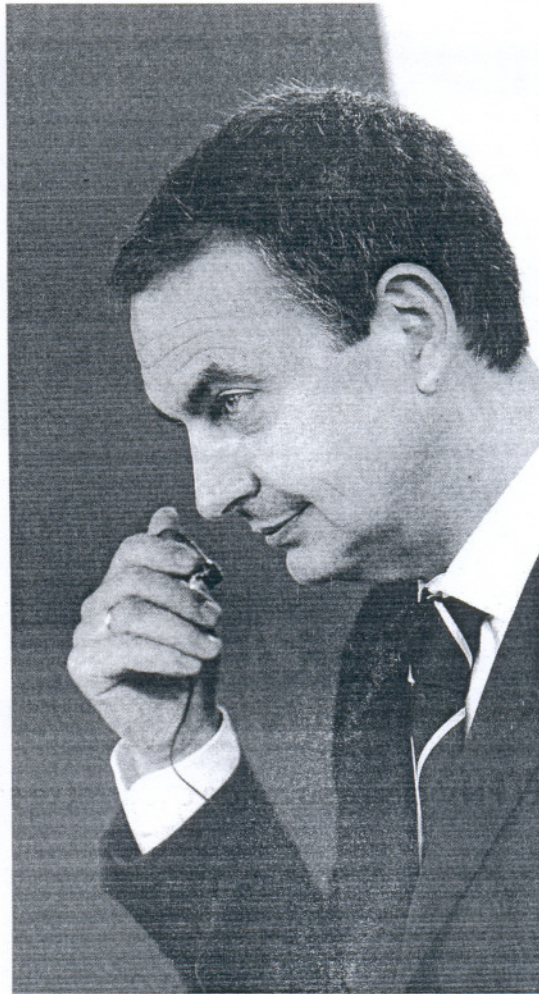
Zapatero, ayer en rueda de prensa en La Moncloa.

"El Gobierno generó una sensación de frustración y engaño, especialmente en Cataluña"