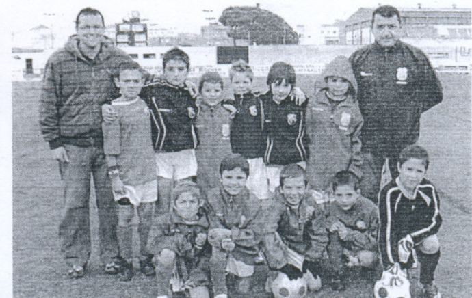
Los benjamines del Rota B no han empatado ningún encuentro después de 22 jornadas.