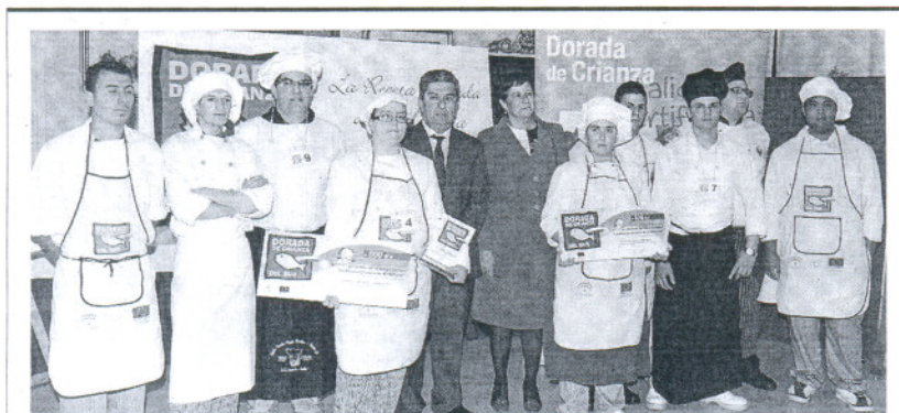
CERTAMEN. La gaditana participó en el certamen que busca descubrir nuevos chefs.