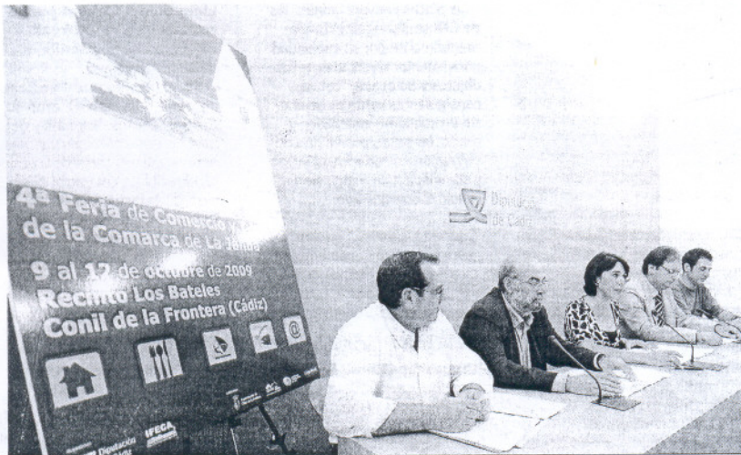
Representantes del Ayuntamiento de Conil, de Diputación y de colectivos empresariales de Conil presentan la Feria.

El hallazgo movilizó hasta Chipiona a numerosos efectivos de Sevilla, ya que se llegó a barajar la posibilidad de que perteneciera a los restos de Marta del Castillo, la joven sevillana desaparecida desde enero. Sin embargo, este extremo se descartó casi de inmediato. Ya el pasado lunes, el Instituto Armado reconoció el error e informó de la composición real de la mano, aunque no contó la procedencia del supuesto miembro, ni si alguien había denunciado su extravío. El último giro de esta "monstruosa" historia ha sido auténticamente de película.