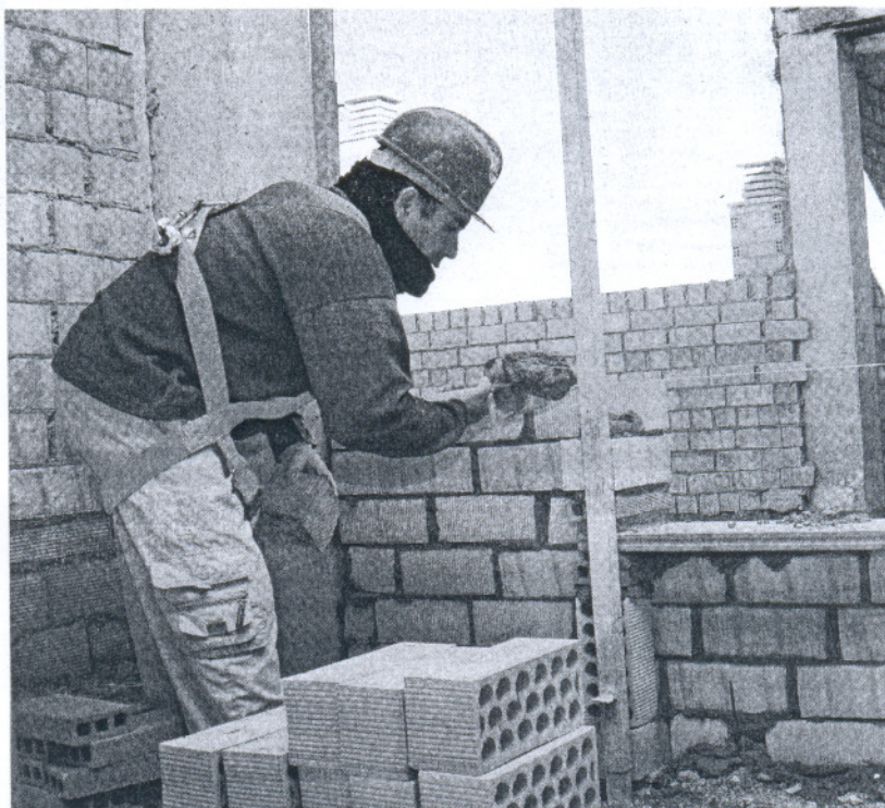
Un albañil trabaja en una promoción de viviendas.

A ello hay que sumar los entre 12.000 y 18.000 millones que a 31 de marzo debían las comunidades autónomas. José Miguel Martín,