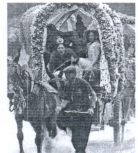
La seguridad es primordial. / J. C. C.

Los avisos relacionados con requerimientos de información de los ciudadanos, así como solicitudes de paso y señalización de las hermandades, han vuelto a ser los más numerosos (478), seguidos de las asistencias sanitarias (313), que por primera vez en el desarrollo de la romería han desplazado a las llamadas informativas (232)