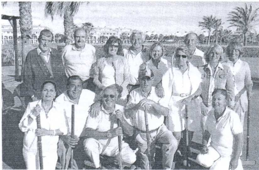
ÉXITO. Los participantes posan tras finalizar su competición.