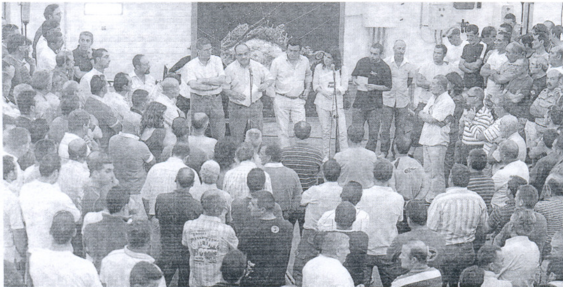
MASIVA. Las cuatro almadrabas gaditanas se reunieron ayer en Barbate para tomar medidas.