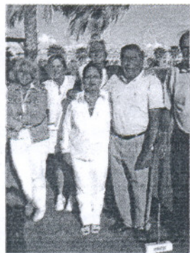
Costa Ballena.

El clima acompañó y se encargó de subrayar el juego en equi-