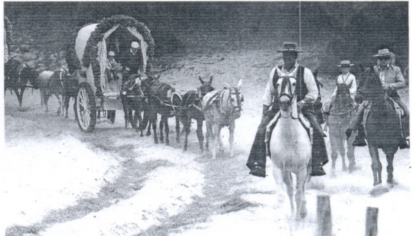
FINAL. Las carretas ya ultiman su regreso y están ya a las puertas de llegar a casa.

Despertarán este jueves. Y lo harán tanto en la tienda de campaña anclada en el lugar de marras como en el alma romera devuelta a la cotidianidad de todo un año de nueva espera. Despertarán, y con ellos no han podido ir este año a El Rocío -habemus crisis- esperan verse envueltos hoy del aroma fragante del romero que, si Dios quiere, podrán repartir a su entrada. Ellos saben que van con esa matita mucho más que una especie -protegida por cierto- olorosamente agradable. Con ella entregan el alma cultivada en Doñana. ¡No retrasaros!