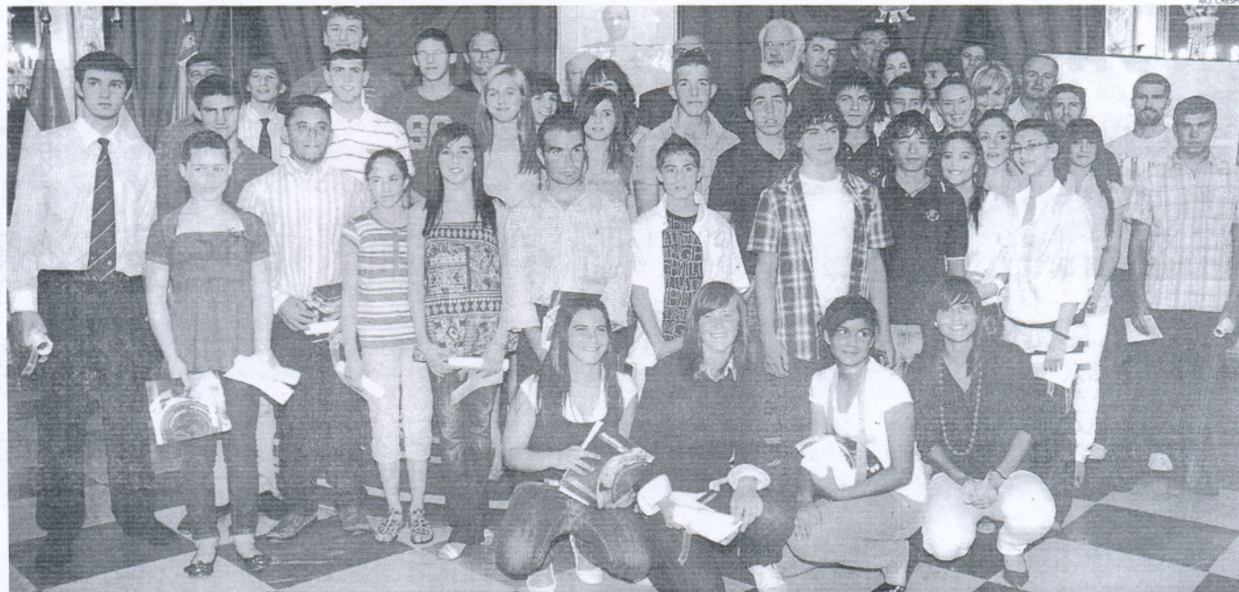
La Diputación Provincial de Cádiz, a través de su Instituto para el Fomento del Deporte (IFD), distinguió este año a un total de 55 deportistas de la provincia gaditana.