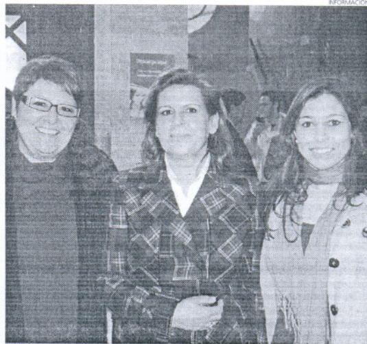
La delegada de Cultura asistió a la firma del convenio en Sevilla.

La delegada destaca que "la cultura, en este tiempo, se ha convertido ya en un derecho, no en un privilegio de unos pocos". Con esta intención se ponen en marcha desde el área municipal de Cultura, toda una línea de facilidades que van desde los abonos, a la reducción de precios, así como la colaboración con artistas y grupos locales.