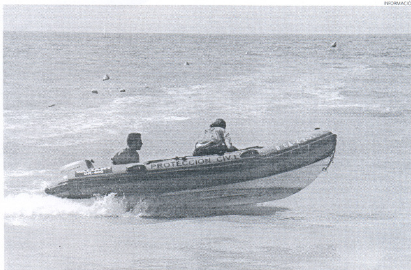
Protección Civil ha evaluado sus actuaciones durante el año pasado, para sacar conclusiones de los resultados.

Ya en menor medida, y siguiendo con el desglose de ac-