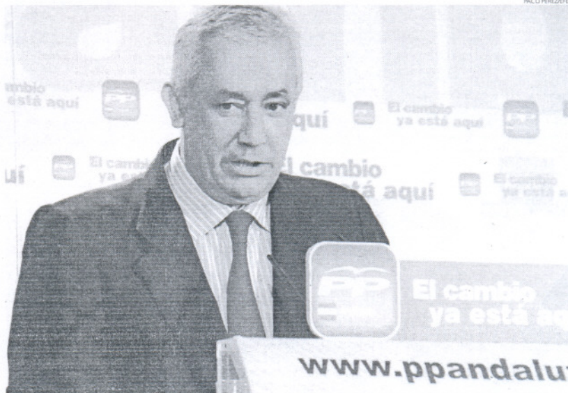
El presidente del PP-A, Javier Arenas, durante la Jornada sobre Igualdad de Oportunidades celebrada ayer.

"Un millón de parados ponen de manifiesto una sociedad profundamente desigual", advirtió Arenas, quien agregó que las familias sin ingresos deben ser la principal preocupación para un gobernante, al tiempo que subrayó que la gran desigualdad de