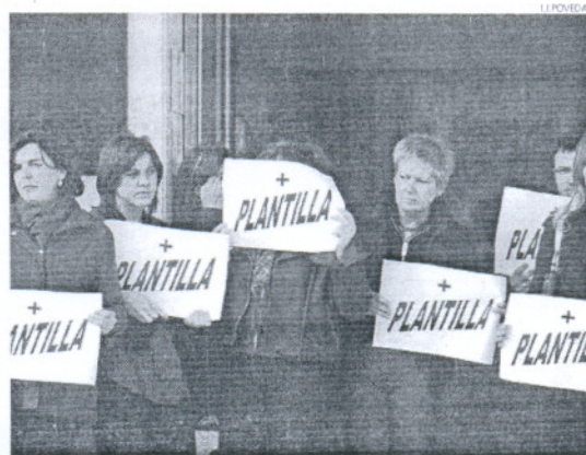
Un grupo de trabajadoras durante la protesta.

Asimismo, hizo referencia a la creación de "nuevas funciones", como el registro de requisitorias y medidas cautelares. Se trata de nuevas funciones y "nuevas responsabilidades" que tienen que asumir los funcionarios sin delegar el resto de sus responsabilidades, con lo que la situación "acaba siendo caótica". El dirigente sindical señaló que la próxima acción de protesta, "casi con toda probabilidad", será el viernes próximo en los juzgados de lo Penal de Jerez de la Frontera.