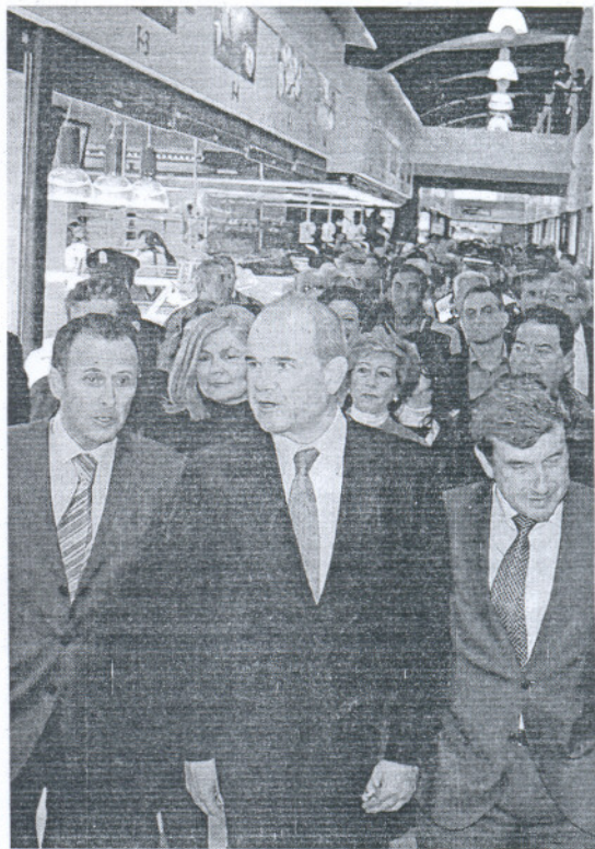
Chaves, ayer en la inauguración del mercado de Chiclana

Por su parte el presidente del PP de Andalucía, Javier Arenas, respondió a las acusaciones de Chaves que la «presunta corrupción es estructural en un partido -en referencia al PSOE- que ha sido condenado por casos como Filesa y el del GAL».