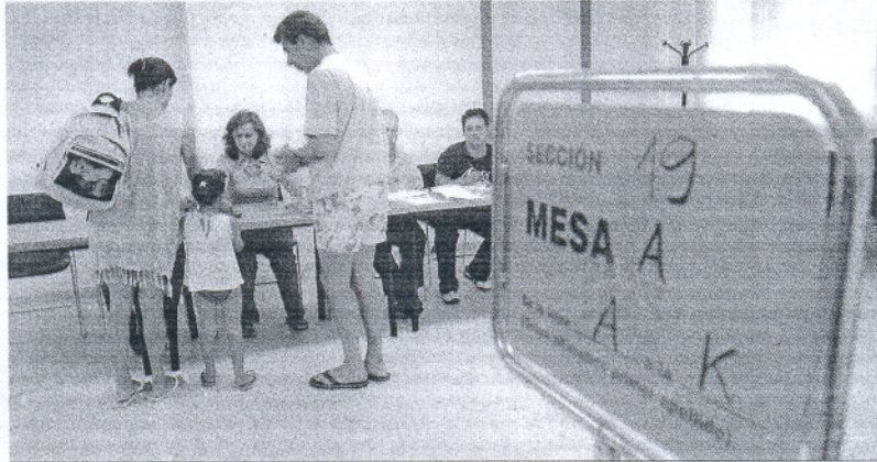
Una familia gaditana ejerce su derecho al voto en las últimas europeas antes de ir a la playa, en junio de 2004.

Para la cita de hoy, 969.898 electores gaditanos —un nuevo récord— están llamados a votar para elegir a sus representantes europeos. De esta cifra total, 948.077 constituyen el censo de residentes, 18.452 son los electores gaditanos residentes en el extranjero y hay 3.369 ciudadanos de la Unión Europea inscritos en Cádiz