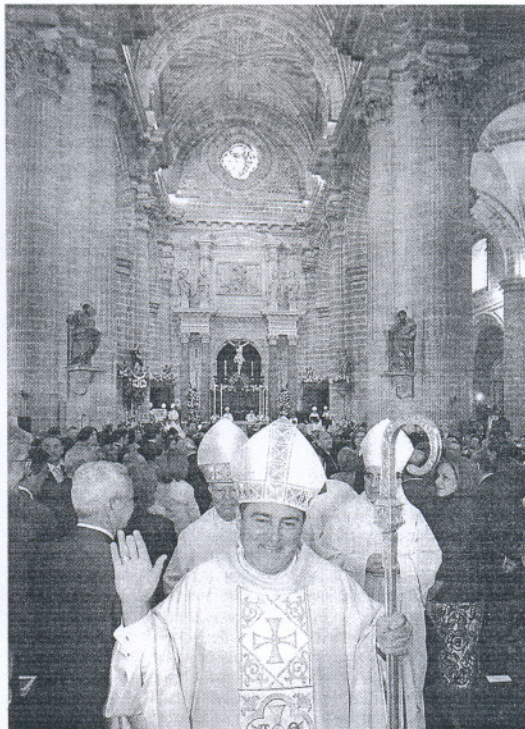
El nuevo obispo recorriendo la Catedral tras la comunión.