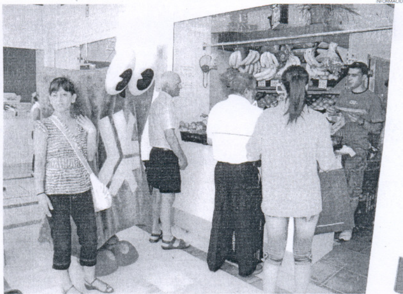
La mascota de la Oficina del Consumidor visitó el mercado para hacer más llamativa la campaña de información.

Además, a través de esta misma actuación, dos monitoras y Omíco, la mascota de la Oficina Municipal de Información al Consumidor, acompañados del técnico de la citada oficina, entregaron