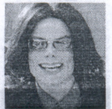
Era el 'rey del pop'.

Fallece Michael Jackson tras ser encontrado en su casa con una parada cardíaca