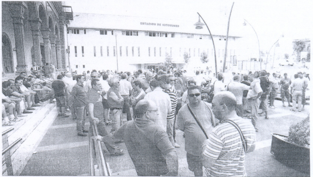
Imagen de la última concentración de ex trabajadores de Delphi en Jerez.

Esta reunión se celebrará en Sevilla, en la sede de la Consejería de Innovación, y a ella han anunciado su asistencia muchos de los