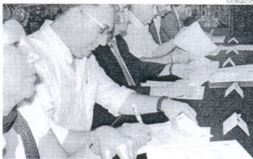
Firma del convenio ayer en Diputación.