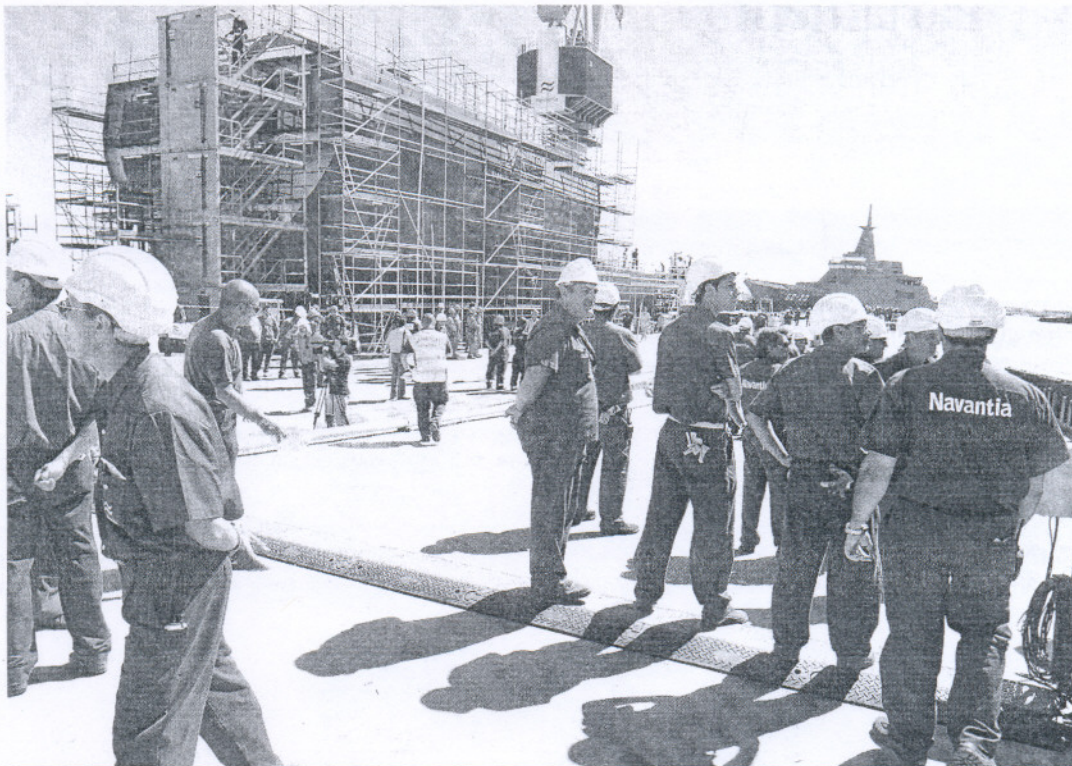
Un grupo de trabajadores de Navantia, el pasado miércoles durante la botadura de un buque para Venezuela.

El importe de ese pedido de la Marina australiana se eleva a más de 800 millones de euros. Además, la empresa pública española ha realizado el diseño y transferirá la tecnología y el equipamiento de tres fragatas F-100, iguales que la Álvaro de Bazán, que se construirán en Australia y cuyo precio supera los 500 millones de euros. La compañía española realizará también para la Marina australiana la propulsión, las líneas de ejes, los reductores y el sistema de mando y control de la plataforma, que se llevan a cabo en la fábrica de artillería de San Fernando, lo que supondrá para la empresa española otros 200 millones de euros y trabajo para 400 personas al menos durante 24 meses a partir de ahora.