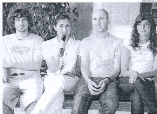
La delegada de Cultura ha animado a los roteños a asistir a este cierre.

La delegada de Cultura quiso felicitar a los componentes del taller municipal por el trabajo que han venido haciendo en este año, así como al monitor del taller "por la labor que desarrolla con niños y jóvenes a la hora de acercarles el teatro".