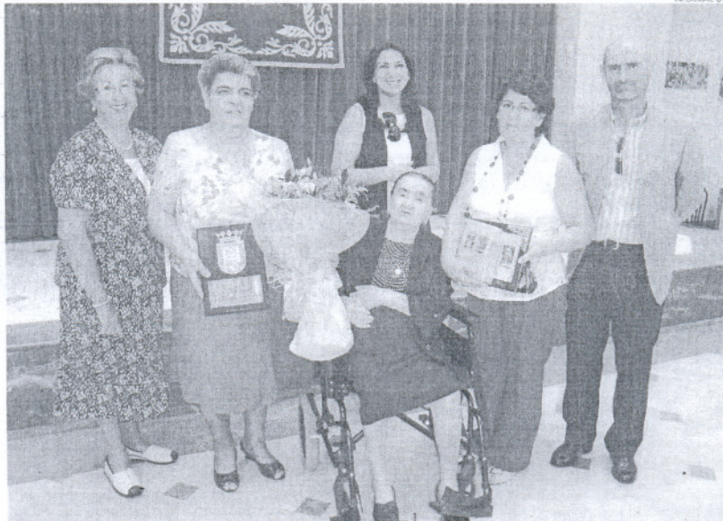
Los homenajeados vivieron un día muy emocionante acompañados de sus seres queridos y de sus compañeros.