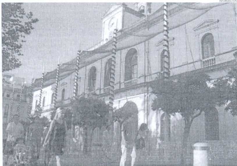
Los ayuntamientos andaluces han optado por no acogerse a la línea de créditos ICO para pagar a proveedores.

A falta de datos actualizados el ICO prefiere esperar a este viernes para cerrar sus cuentas: los referidos al 7 de julio y recogidos por Europa Press, en Andalucía se han presentado y formalizado 4.794 facturas a 449 clientes de