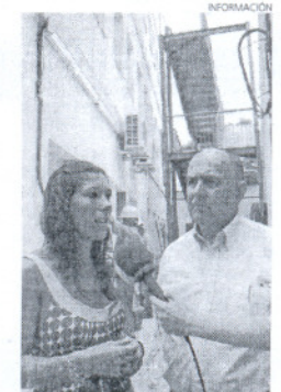
Es una obra muy necesaria.

Quince días antes del pleno de elecciones se comunicará a los Hermanos Mayores las candidaturas que concurrirán a las elecciones.