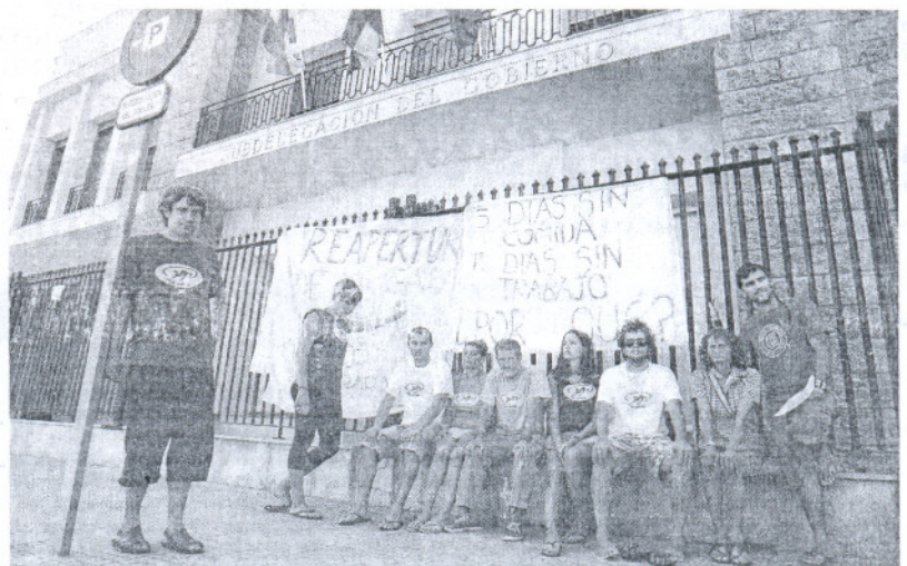
Trabajadores de La Gata concentrados ayer ante la sede de la Subdelegación del Gobierno.

El dueño del local entregó ayer en la sede de la Subdelegación un manifiesto con numerosas firmas pidiendo la reapertura del chiringuito. Los trabajadores portaban dos pancartas en la que reclamaban la vuelta a la actividad del establecimiento y llamaban la atención sobre los días que llevan sin trabajo (11) y lo que llevan en huelga de hambre (5). Además gritaron consignas a favor de la apertura como "¡queremos trabajar!".