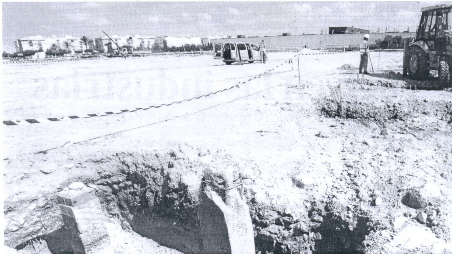
Primeros pilotes de la futura factoría de Alestis, en Puerto Real. Al fondo, la antigua planta de Delphi.