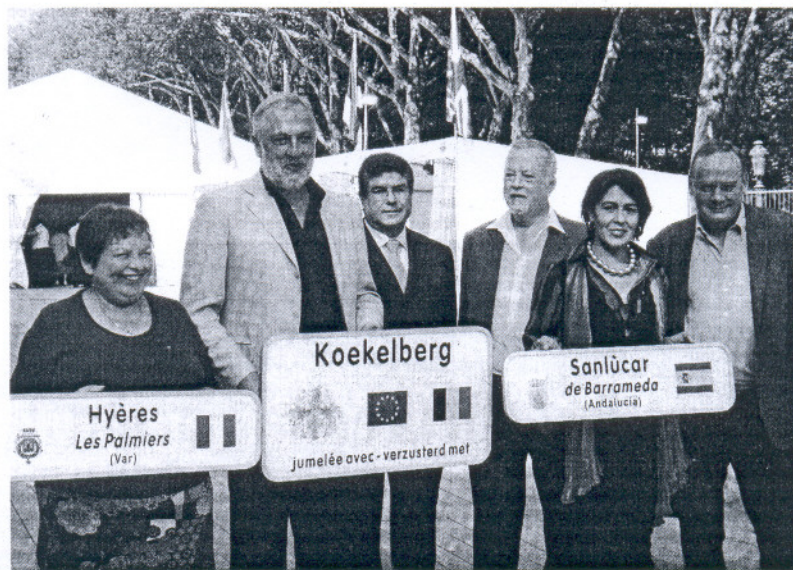
Los concejales de Turismo y Fomento han representado a Sanlúcar en la Feria de la Amistad de Koekelberg.