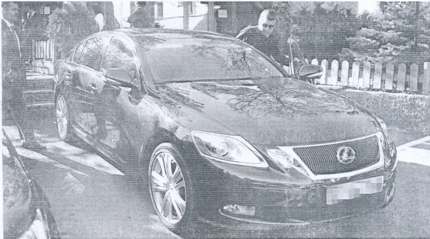
El coche oficial del consejero de Turismo fue objeto de polémica después de que la viceconsejera de Extremadura dimitiese tras ordenar la compra de un vehículo similar