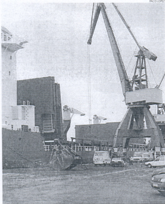
El plan de reindustrialización ha favorecido la creación de 500 empleos.

Este plan de reindustrialización, del que está en marcha ya una segunda edición está dirigido a 14 municipios, siete de los cuales se agrupan en la Mancomunidad de Municipios de la Bahía de Cádiz (Cádiz, Chiclana, El Puerto de