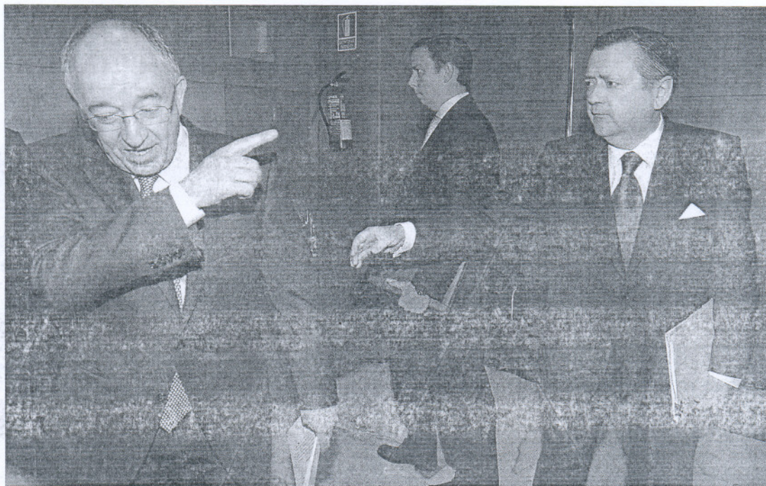
El gobernador, Miguel Ángel Fernández Ordóñez (izquierda), y el consejero delegado del Santander, Alfredo Sáez, ayer en un acto.