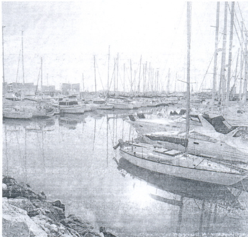
PUERTO SHERRY. Barcos deportivos atracados en el muelle portuario.

Falta por ubicar la estación central pero cada localidad tendrá una sede propia