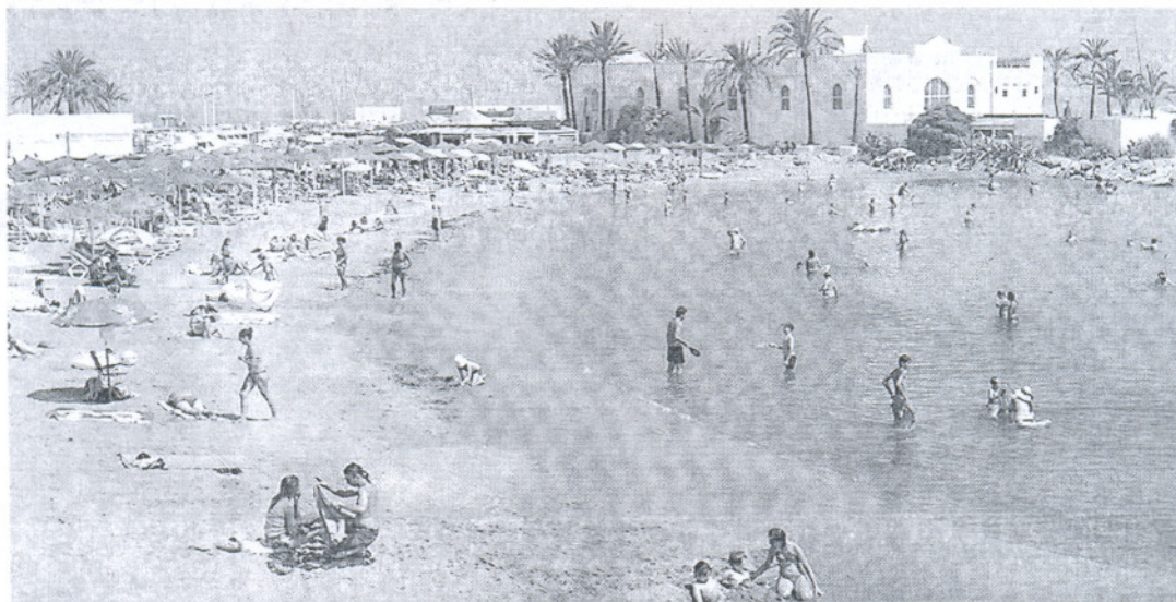
Una playa malagueña cercana al puerto de Marbella.

Andalucía es de los pocos destinos del país que consiguió mejorar los resultados de la Semana Santa con respecto al año pasado • El PIB turístico español bajará un 5,6% en 2009 según Exceltur