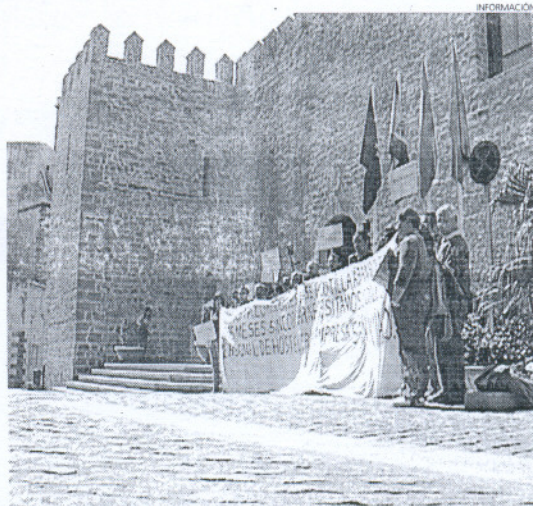
Los trabajadores han acudido al Consistorio en busca de ayuda.

Los trabajadores esperan una respuesta firme que les ayude a definir sus próximos pasos.