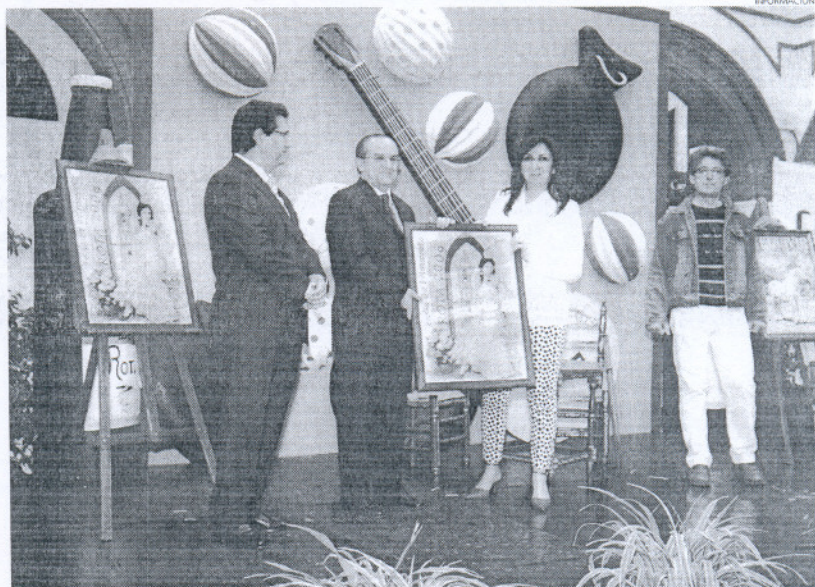
El cartel de este año aúna la tradición del traje de flamenca con una estampa típica del casco histórico de Rota.

Tras conocer el cartel, el delegado de Agricultura, se refirió al cartel como una imagen que rompe los esquemas de los carteles que se han venido haciendo hasta ahora, ya que además de representar al caballo ganador, con las cualidades y nivel de este ejem-