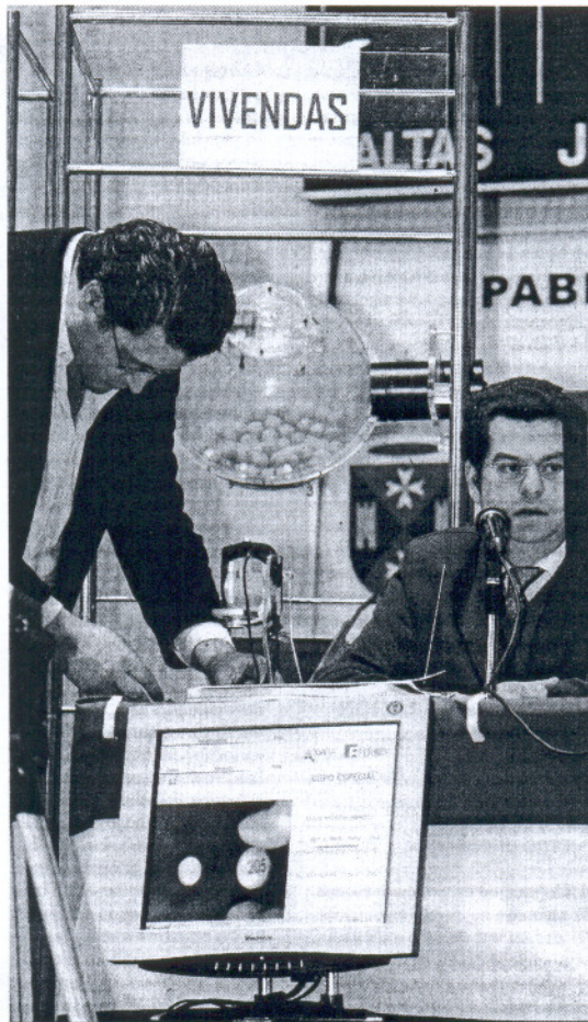
Sorteo de viviendas protegidas en Sevilla.

El consejero explicó que la prioridad es que unos cien ayuntamientos que tienen que adjudicar VPO en el año 2010 sean los primeros en constituir esos registros. El segundo grupo de consistorios deben ser los que más volumen de demanda de VPO tienen, por lo que