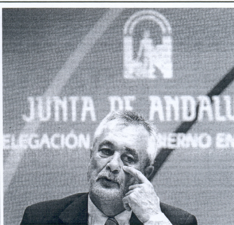
José Antonio Griñán, presidente de la Junta, ayer, durante su visita a Málaga.

En el PSOE son conscientes de la dificultad que entraña esta tarea ante la complejidad y los diferentes modelos de gestión que hay en el entramado de empresas públicas, ya que algunas están en el mercado y otras no, y en ellas cohabitan modelos de financiación pública y privada. Por eso, aunque el Ejecutivo autonómico accediera de inmediato a esta petición, parece casi imposible que ésta tuviera un traslado a los presupuestos andaluces de 2010 por simples motivos de calendario, ya que están en la recta final de su elaboración. Además, aunque esta medida estaba discutiéndose