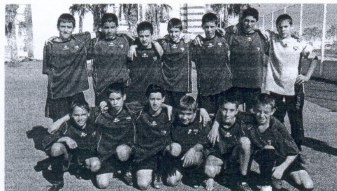
La Roteña infantil mostró muy buenas maneras en el Manuel de Irigoyen.