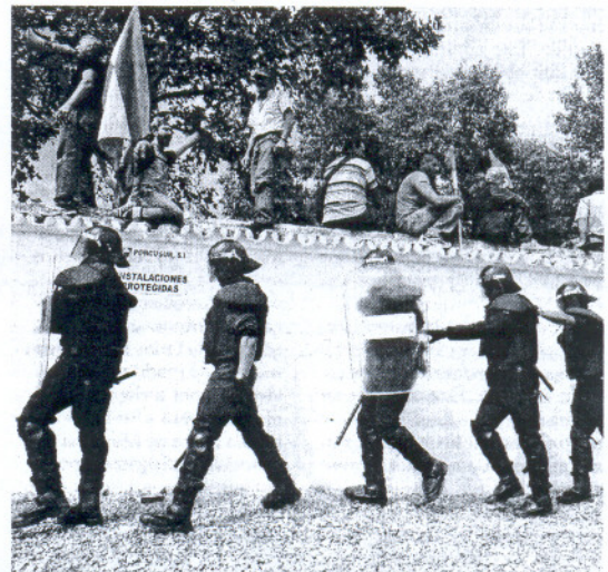
Un grupo de jornaleros, ayer, sobre la tapia de la finca cordobesa.