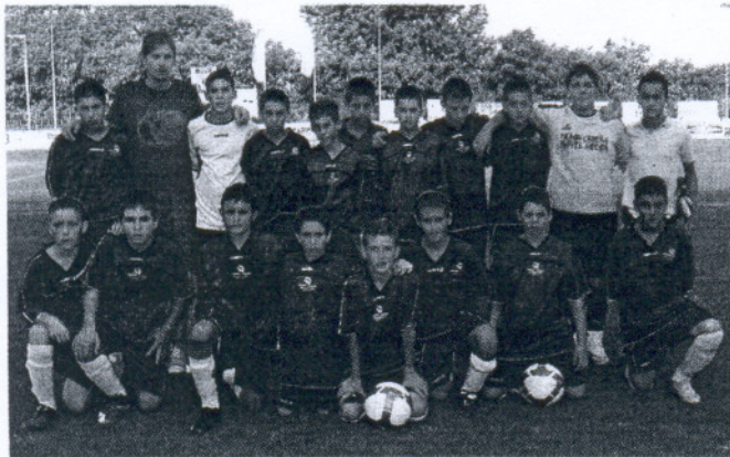
Los infantiles del AD Arcos hicieron méritos para llevarse mayor recompensa.