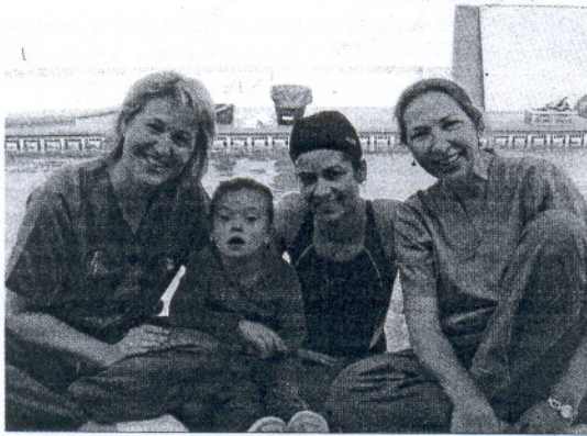
Personal del centro, con una niña, en la piscina.