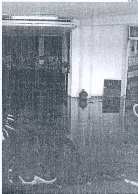
El garaje subterráneo de la Plaza de las Canteras se volvió a inundar.

Por su parte, el cuerpo de voluntarios de Protección Civil de Rota, a través de su coordinador,