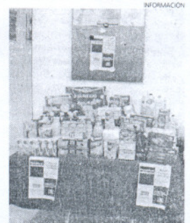
Alimentos donados a Cáritas.

De igual forma, Niño, aprovechó para felicitar las fiestas a todos los roteños y roteñas y para desear "que el nuevo año traiga a todos mucha ilusión, trabajo y salud".