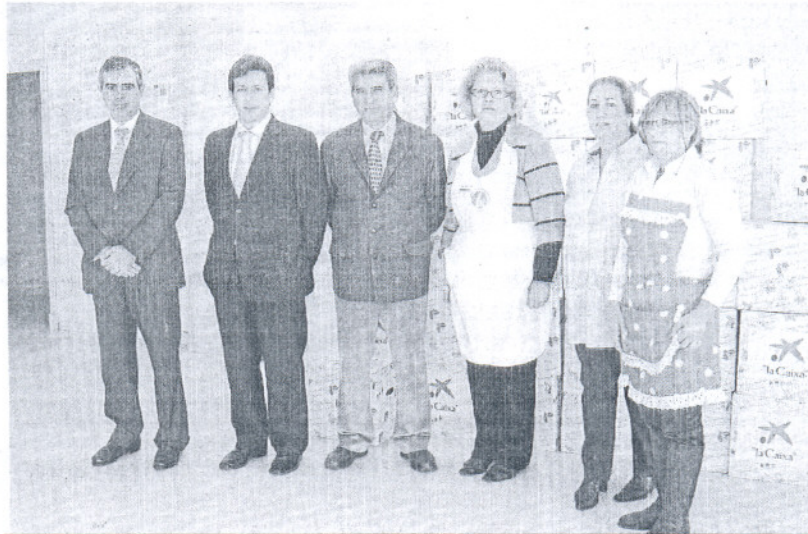
El concejal de Servicios Sociales con representantes de La Caixa y de la plataforma Sanlúcar Solidaria.

La Asociación de Mujeres Solidarias, la Hermandad del Rocío, Cáritas Interparroquial, la Fun-