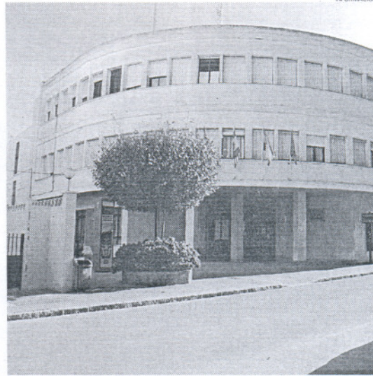
Ambos talleres se celebrarán en la Casa de la Cultura y la Juventud.

De la misma forma, la intención de este taller pasa por ofrecer a los jóvenes técnicas y recursos expresivos aplicados a la prevención de drogas, así como potenciar las