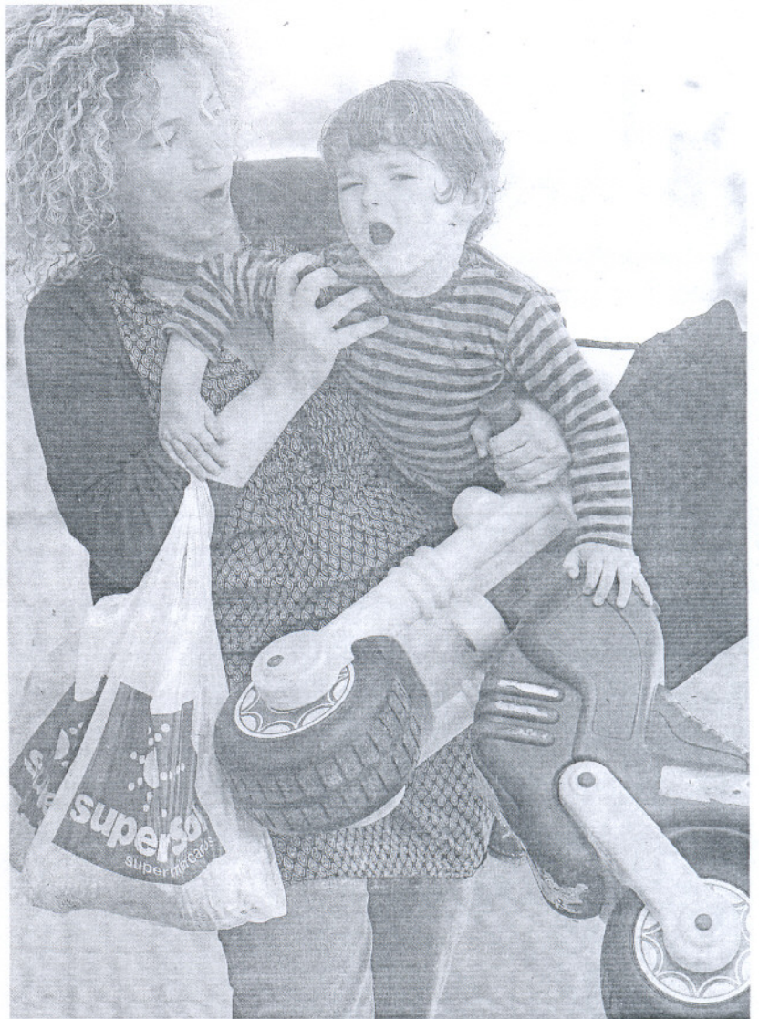
ROLES. Imagen de una mujer de regreso de la compra con su hijo en brazos.

También aparecen diferencias con respecto a la edad en que se empieza a buscar empleo, según este estudio. Un elevado porcentaje de los hombres (56%) comenzó a perseguir su primer trabajo a los 18 años, mientras que las mujeres, por lo general, se incorporan al mundo laboral más tarde. Esto puede explicar en parte el hecho de que las mujeres tengan una menor antigüedad en sus puestos, lo que da idea de una