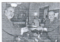
Solbes y Chaves.

1 de octubre. Manuel Chaves y el vicepresidente económico, Pedro Solbes, firman un protocolo de acuerdo con el anticipo de 300 millones de euros.