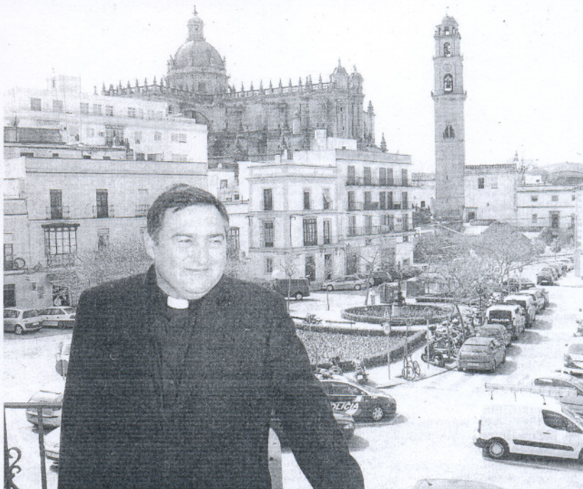
ACOGIDA. El obispo electo de Jerez expresó su «satisfacción» por el recibimiento que ha tenido.