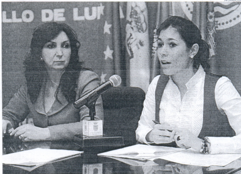
La delegada de Educación ha manifestado "no entender" el por qué del silencio que mantiene aún la Junta.

La delegada de Educación ha comentado que aunque las llamadas a la delegación provincial son constantes, ha fecha de hoy se continúa sin respuesta. Por este motivo, la edil municipal ha querido apelar a la sensibilidad del grupo municipal socialista y le ha solicitado su ayuda y colaboración para que este asunto se resuelva lo más prontamente posible. La delegada asegura que son muchos