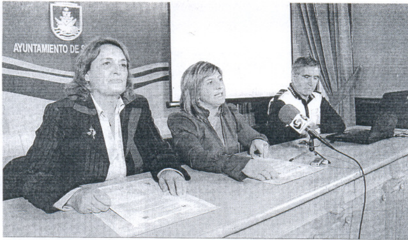
Un momento de la presentación pública del plan especial de tráfico, ayer en el Palacio Municipal.

Aparte de "señalizar debidamente todas las calles", el Consistorio difundirá 10.000 dípticos "con planos e indicaciones espe-