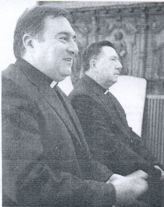
ADMIRACIÓN. Por la labor de su predecesor. / JAVIER FERNÁNDEZ