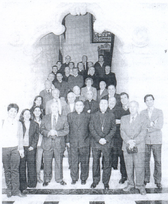
ENCUENTRO. Con los miembros de la Curia y colaboradores.

Sobre su condición de médico dijo que «permite conocer mejor al hombre»