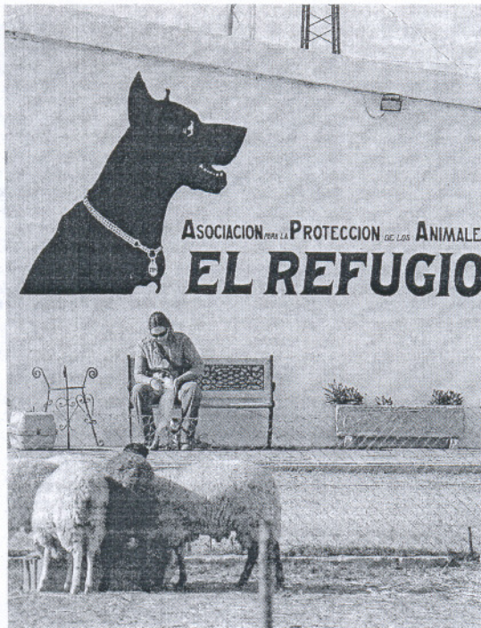
Colectivos como El Refugio gestionan adopciones.

Los abandonos de mascotas este verano superarán las cifras de 2008 con más de 2.000 animales que quedarán sin dueño