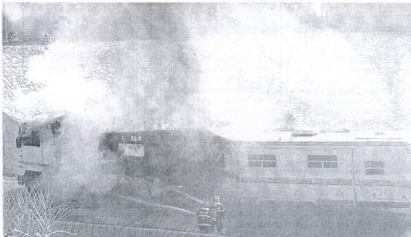
PELIGRO. Los bomberos sofocan las llamas que se concentraron en la parte delantera.