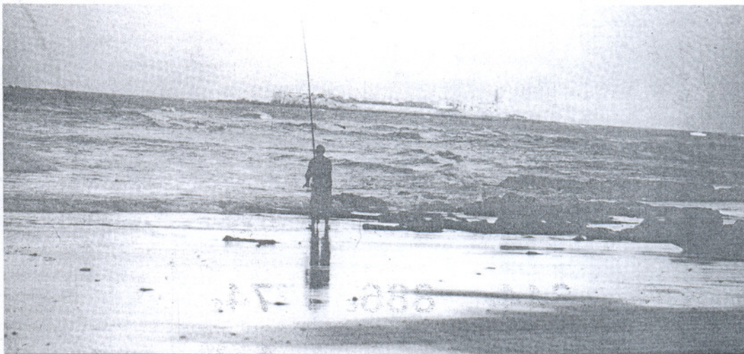
Playa de Sancti Petri, una de los lugares de Cádiz que ostentan la Q de Calidad turística.

Este distintivo aporta una garantía de calidad de los servicios prestados por quien la posee de cara a sus clientes, que obtienen una mayor seguridad en la elección del establecimiento.