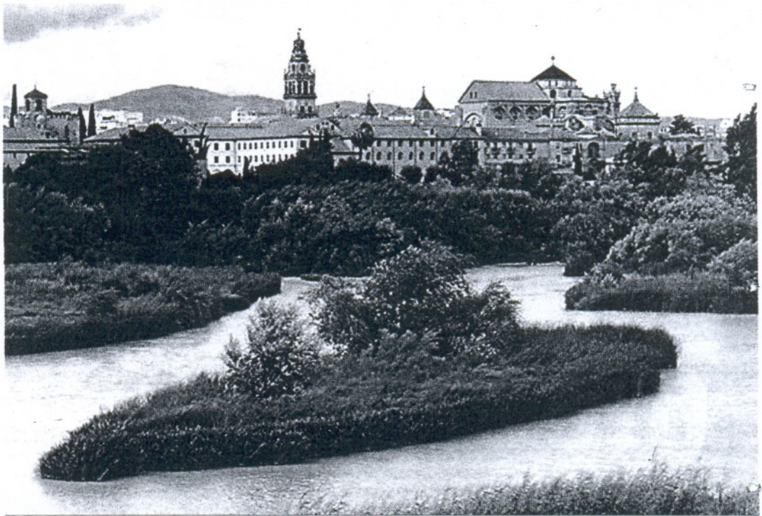
El Guadalquivir, a su paso por Córdoba, con la Mezquita Catedral en fondo.

Los municipios que superen este número de habitantes contarán con planes de emergencia contra la sequía