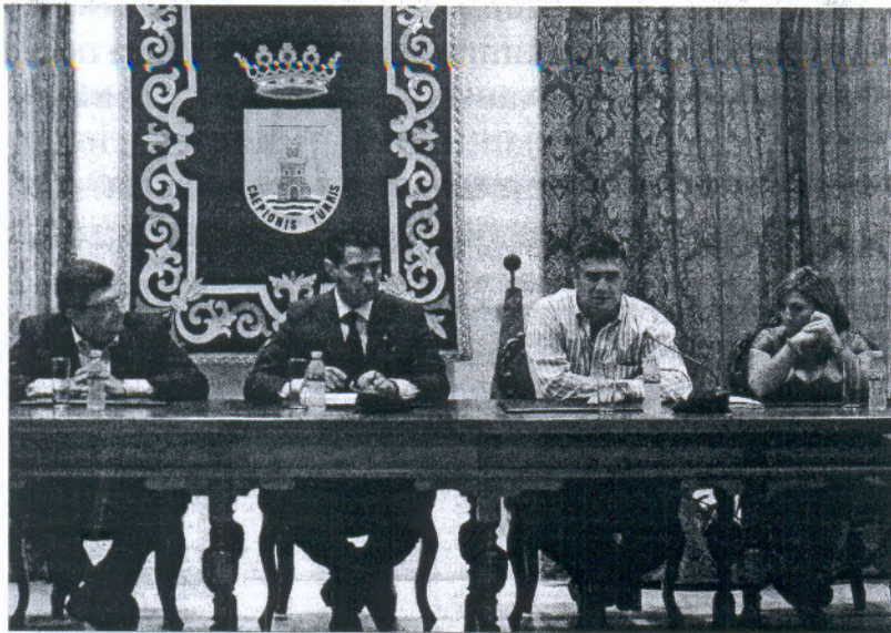
El acto de constitución de la nueva entidad se celebró en el Salón de Plenos del Ayuntamiento de Chipiona. BOGIA BENJUMEDA