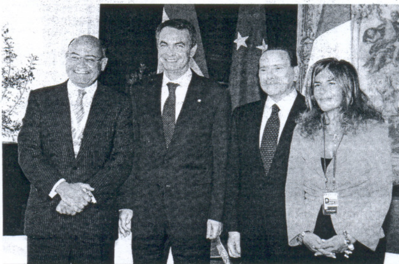
Zapatero y Berlusconi, entre el presidente de la CEOE, Díaz Ferrán, y la de Confindustria, Emma Marcegaglia.

Fuentes del Ejecutivo insistieron en que no pueden hacer públicas las reformas antes de hablar con los