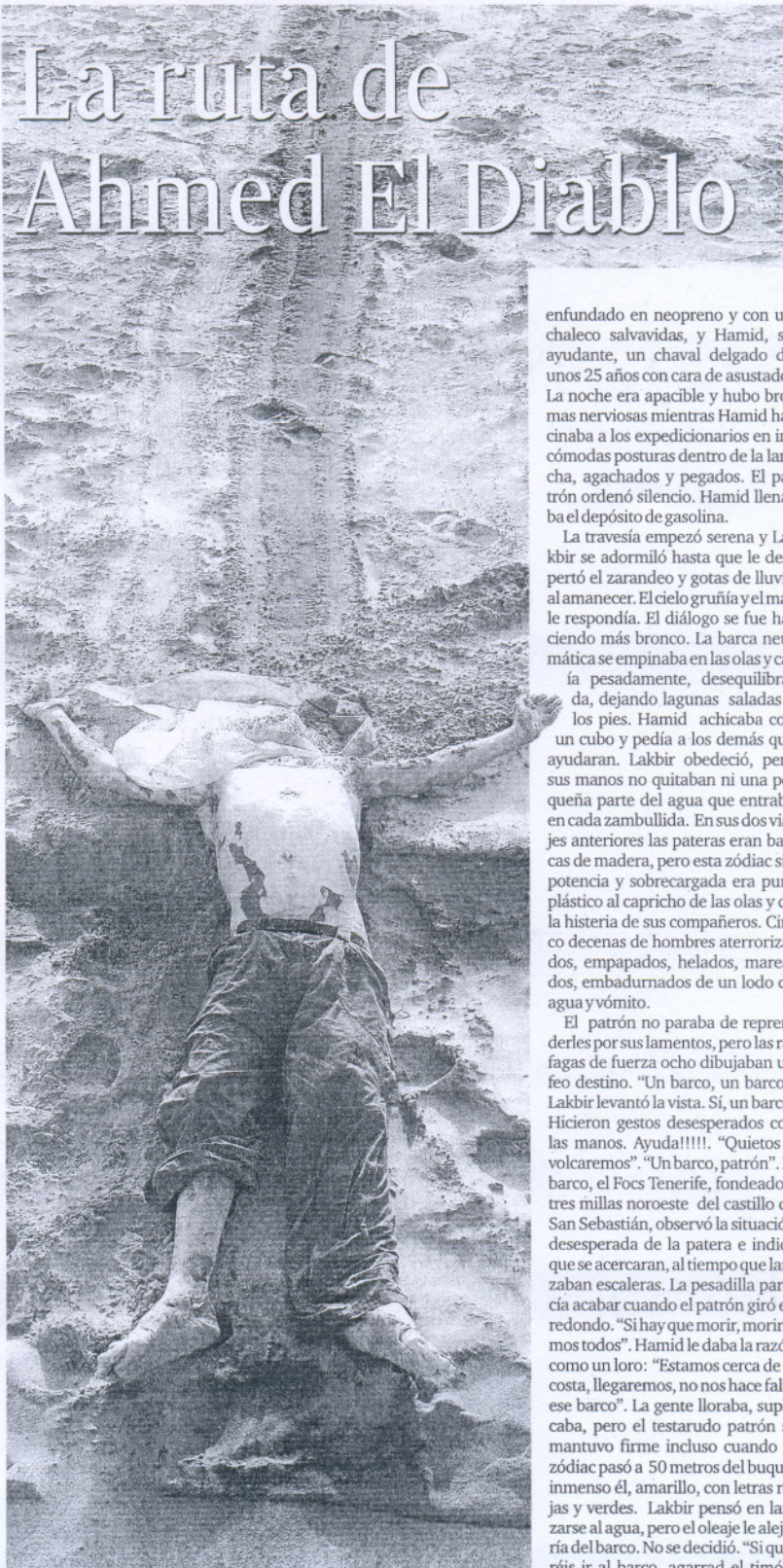
Una de las víctimas de la patera de Rota

enfundado en neopreno y con un chaleco salvavidas, y Hamid, su ayudante, un chaval delgado de unos 25 años con cara de asustado. La noche era apacible y hubo bromas nerviosas mientras Hamid hacinaba a los expedicionarios en incómodas posturas dentro de la lancha, agachados y pegados. El patrón ordenó silencio. Hamid llenaba el depósito de gasolina.