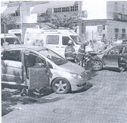
Un accidente ocurrido en la Avenida del Cerro Falón.

También en materia de tráfico, el Gobierno considera que "la acción de los agentes de la Policía Local ha supuesto igualmente que salgan a la luz numerosas personas que circulaban sin el correspondiente permiso de conducción y que suponían un constante peligro para el resto de los ciudadanos". En este sentido, ha asegurado que "desde que entró