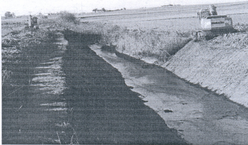
Los Ecologistas consideran que con estas obras se está "destrozando" el hábitat de las riberas del arroyo.

Según denuncian los Ecologistas, estos trabajos, provocados por las peticiones que hicieron los colindantes a raíz de las excepcionales lluvias de octubre, ha su-