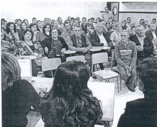
La alcaldesa (izq.) explicó el proyecto a los vecinos de La Dehesilla.

Según subrayó la alcaldesa, ambas administraciones invertirán en el Barrio Alto más de dos millones de euros para generar más de 80 puestos de trabajo con obras como la mencionada de la Avenida de la Marina, cuyo presupuesto supera los 220.000 euros. Quiso dejar claro que "la mayor parte de las actuaciones son las que los vecinos pidieron al Ayuntamiento en las asambleas infor-