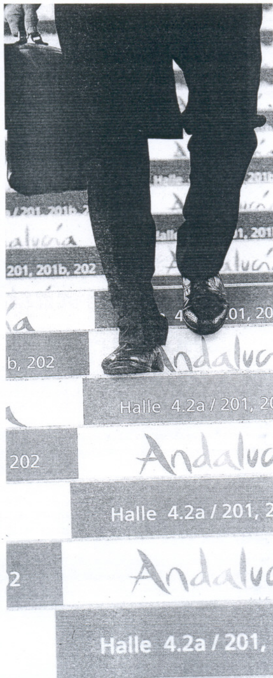
Imagen de uno de los visitantes de la ITB de Berlín.

Los acuerdos promocionales firmados en la ITB suponen una inversión conjunta (50% Administración, 50% empresa) de más de 2,4 millones de euros este año. El más importante es el liderado por el touroperador TUI, principal organizador y vendedor de vacaciones en Europa con destino a Andalucía. El evento incluye un programa de acciones comerciales y de marketing dirigidas a 11.000 agencias germanas, cuyos profesionales participarán en un