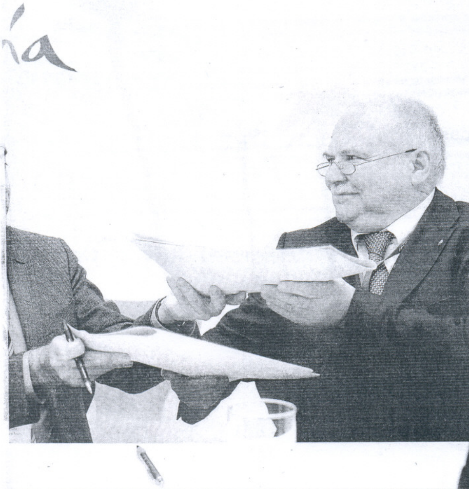
El consejero de Turismo y el director de producto de Thomas Cook firman un acuerdo de colaboración.