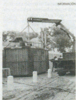
Módulos de servicios nuevos.

Corrales ha recordado a peñas y entidades con casetas que hoy termina el plazo para el concurso de decoración interior.