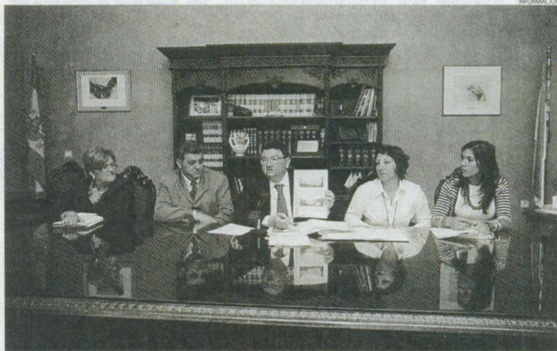
El alcalde ha extraído conclusiones muy positivas de este encuentro por parte de Dominio Público y Costas.