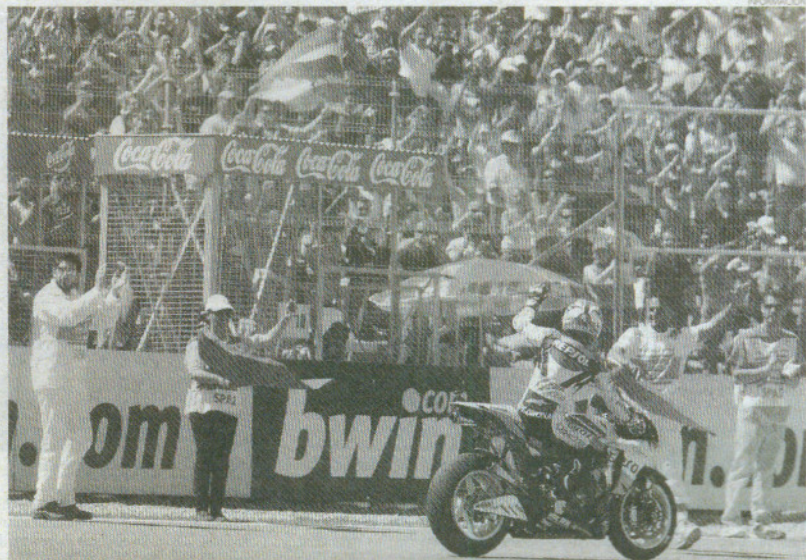
La Junta destaca la imagen positiva que proyecta de Andalucía la celebración del Gran Premio de España.

cia en el accionariado de Cirjesa". "Esto nos permitirá proyectar al circuito y su funcionamiento, con un punto de partida que se escribe desde ahora de forma diferente", afirmó la primera autoridad municipal.