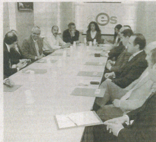
Un momento del encuentro celebrado ayer en la sede de la patronal.