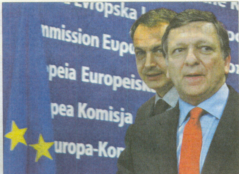
Zapatero y Durão Barroso, tras la rueda de prensa de ayer.

Barroso mostró su agradecimiento de manera práctica al garantizar la presencia de España en el G-20. "El G-20 no tiene sentido si España no está. Me parece lógico confirmar formalmente la participación de España en todas las citas del G-20. España", añadió, "puede contar con mi apoyo y el de la Comisión en este sentido".