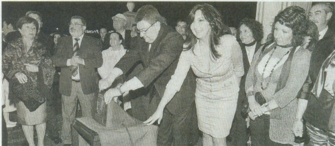
PROTOCOLO. Miembros del equipo de Gobierno en el acto previo al comienzo de la feria.