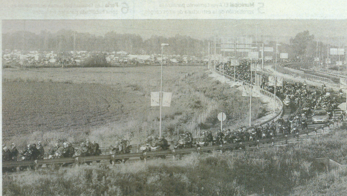
ACCESOS. Imagen de moteros en las inmediaciones del Circuito el año pasado el día de la celebración del Gran Premio de Motociclismo.