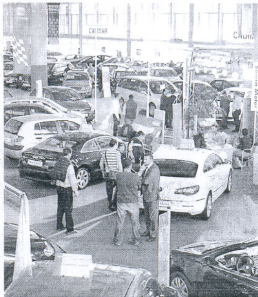
Salón del Automóvil celebrado en Jerez el pasado mes de marzo.