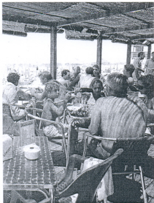
Gaditanos comiendo en un chiringuito.

Cuarenta y dos establecimientos participan en la Ruta del Tapeo, que se prolongará hasta el mes de septiembre