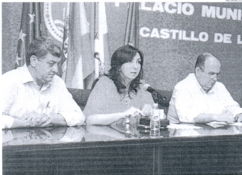
Las obras del Plan E marchan correctamente en la localidad, según se ha constatado en la junta de portavoces.