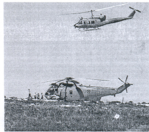
EMERGENCIA. El helicóptero, obligado a aterrizar.

El helicóptero se encontraba realizando unos ejercicios de adiestramiento en la zona cuando tuvo que realizar el aterrizaje forzoso. No se registraron daños personales durante la maniobra de emergencia, mientras que el aparato pasará la noche en la zona del aterrizaje custodiado por miembros de la Armada a la espera de su traslado por vía terrestre. El adiestramiento de la quinta escuadrilla es riguroso y diverso, debido a su notable polivalencia, que abarca misiones de tipo asalto anfibio, guerra naval especial, transporte logístico, salvamento en combate (CSAR), SAR, evacuaciones médicas (Medevac), así como guerra antiaérea, según la Armada.