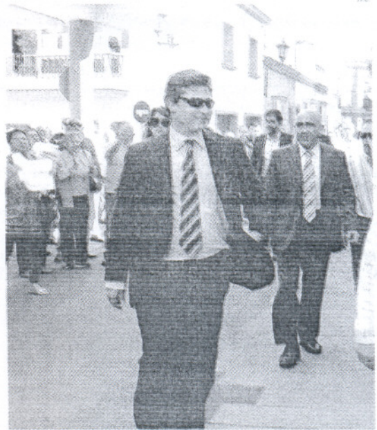
Los ciudadanos volvieron a pedir la dimisión de De Bernardo.