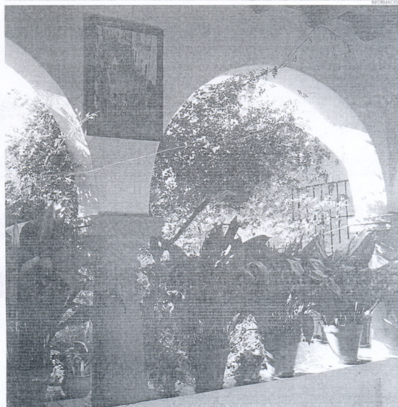
La costumbre de cuidar y decorar los patios aún pervive en el municipio, existiendo rincones de gran belleza.

Rincones, el delegado explicó que las fotos que concursen deberán ser originales y no haber sido presentadas a otros certámenes. Además, cada participante podrá entregar un máximo de tres fotografías.