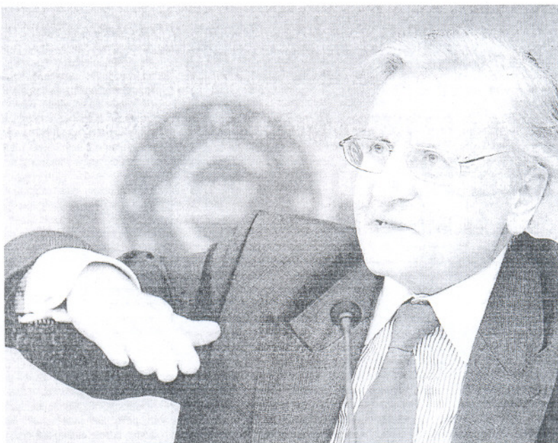
El presidente del BCE, Jean-Claude Trichet, ayer, tras la reunión del consejo de la autoridad monetaria.

El dinero está cada vez más barato. En concreto, en un histórico nivel del 1%, tras el recorte de 25 puntos básicos aprobado ayer por el BCE en su reunión mensual. Todos los analistas coinci-