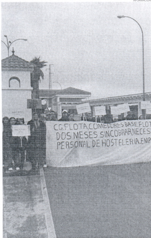
Los empleados de San Xiao en una de las concentraciones.

Los ex empleados de la empresa gallega San Xiao mantienen algunas esperanzas de volver a trabajar, pero en cambio, "hemos pa-