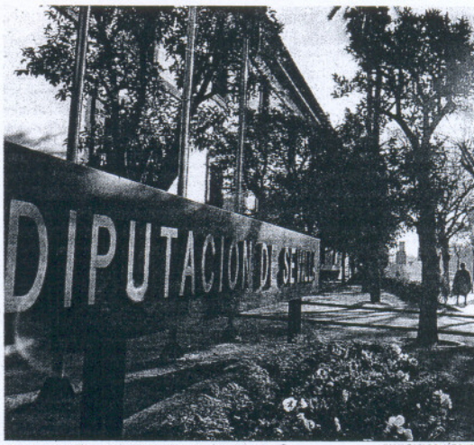
Sede de la Diputación Provincial de Sevilla.

De entrada, ninguno de los tres grupos políticos tiene en mente la disolución o reforma de las corporaciones provinciales. Más bien al contrario: lo que se pretende, sobre todo desde el prisma del PSOE, es dotar de una misión efectiva a estas entidades heredadas del antiguo organigrama institucional previo a la democracia -y sobre las que se construyó la autonomía- para que puedan perdurar en el tiempo, ser úti-