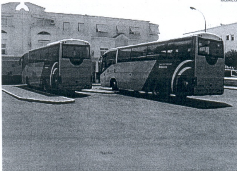
Estos cambios mejoran en cierta medida la conexión de Rota con otras ciudades de la bahía de Cádiz.

Así, con esta última ciudad, contando con las líneas directas así como con las que unen con Cádiz y Puerto Real el ciudadano con-