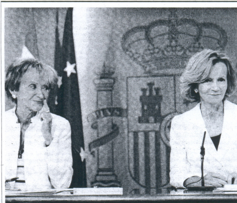
Las vicepresidentas primera y segunda del Gobierno, María Teresa Fernández de la Vega y Elena Salgado.

Las previsiones de Afi-Agett apuntan a que el paro seguirá experimentando aumentos "significativos" en lo que resta de año, situándose el volumen de desempleados en 4,5 millones al finalizar el ejercicio, lo que llevará