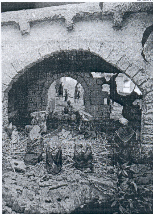
Los belenes y dioramas son tradiciones navideñas que no han de perderse.

La Entidad organizadora recomienda que el tema central de los Belenes y Dioramas que concurren al Concurso, sea el Misterio del Nacimiento, que se deberá representar con fidelidad y de acuerdo a las costumbres de la tradi-